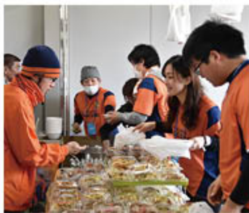
▲オリジナル「スタジアムグルメ」を販売するJ Aブース

J Aは、28年度もサッカーJリーグ3部の「AC長野パルセイロ」に協賛し、サッカーを通じた「次世代」へのJ A産農産物のPRをはじめ、篠ノ井地区などJ A管内地域の活性化事業へ寄与していきます。 これにあわせ、3月20日、篠ノ井東福寺の南長野運動公園総合球技場で行われた同チームのホーム開幕戦にJ Aブースを初出店しました。1月から雪中貯蔵した野菜を使用した「豚汁」などを販売。ブース前には長蛇の列ができるなど大盛況でした。 今後もホームゲームを中心に、旬の農産物などを販売しながら、PRにつなげていきます。