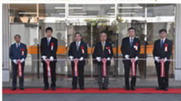
▲テープカットを行う代議者(3月8日)

J Aは3月8日、川中島支所内に「コミュニティプラザ川中島」を開設しました。J A福祉事業の充実化、組合員組織活動等の利用を目的に、同支所内旧店舗を改装。イベントスペースを設けました。 同施設を会場に15日、65歳以上の組合員・地域住民を対象とした介護予防サロン「グリーンカフェ」を初めて開きました。カフェは、「高齢者の生きがいづくり」が目的。女性部や地域住民ボランティア、J A厚生連病院の協力のもと、毎週火曜日に定期開催し、各種講座や茶話会を通じた高齢者の健康生活と「地域のよりどころ」をめざします。