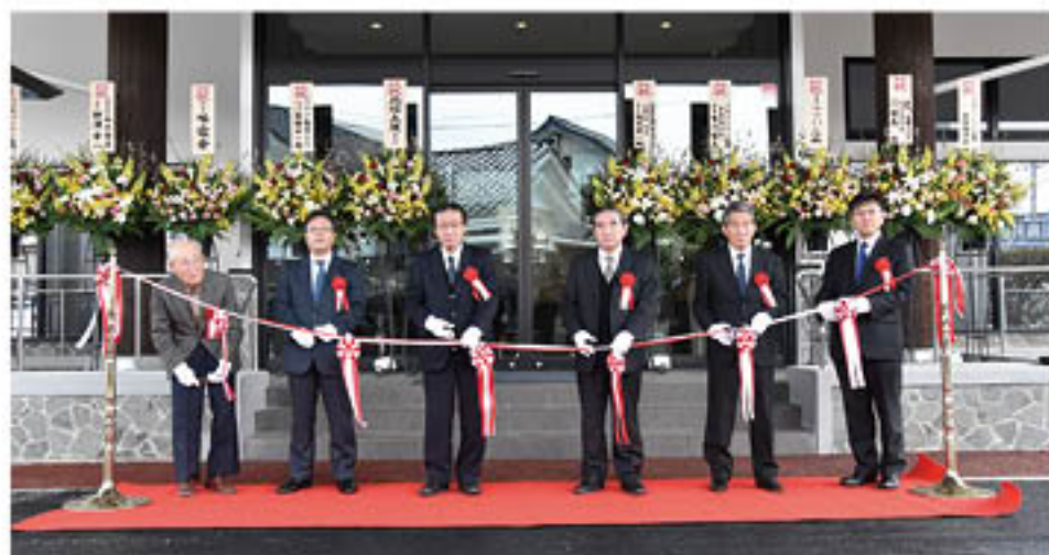
▲テープカットを行う関係者(3月1日)