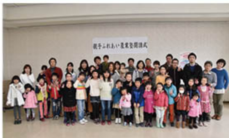
▲全員で記念撮影をする参加者