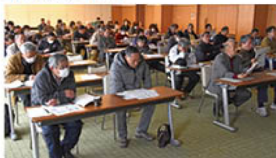
▲熱心に学ぶ受講生

JAが、年間を通して組合員・地域住民向けに開講してきた2つの講座の閉講式を3月12日、2会場で開きました。