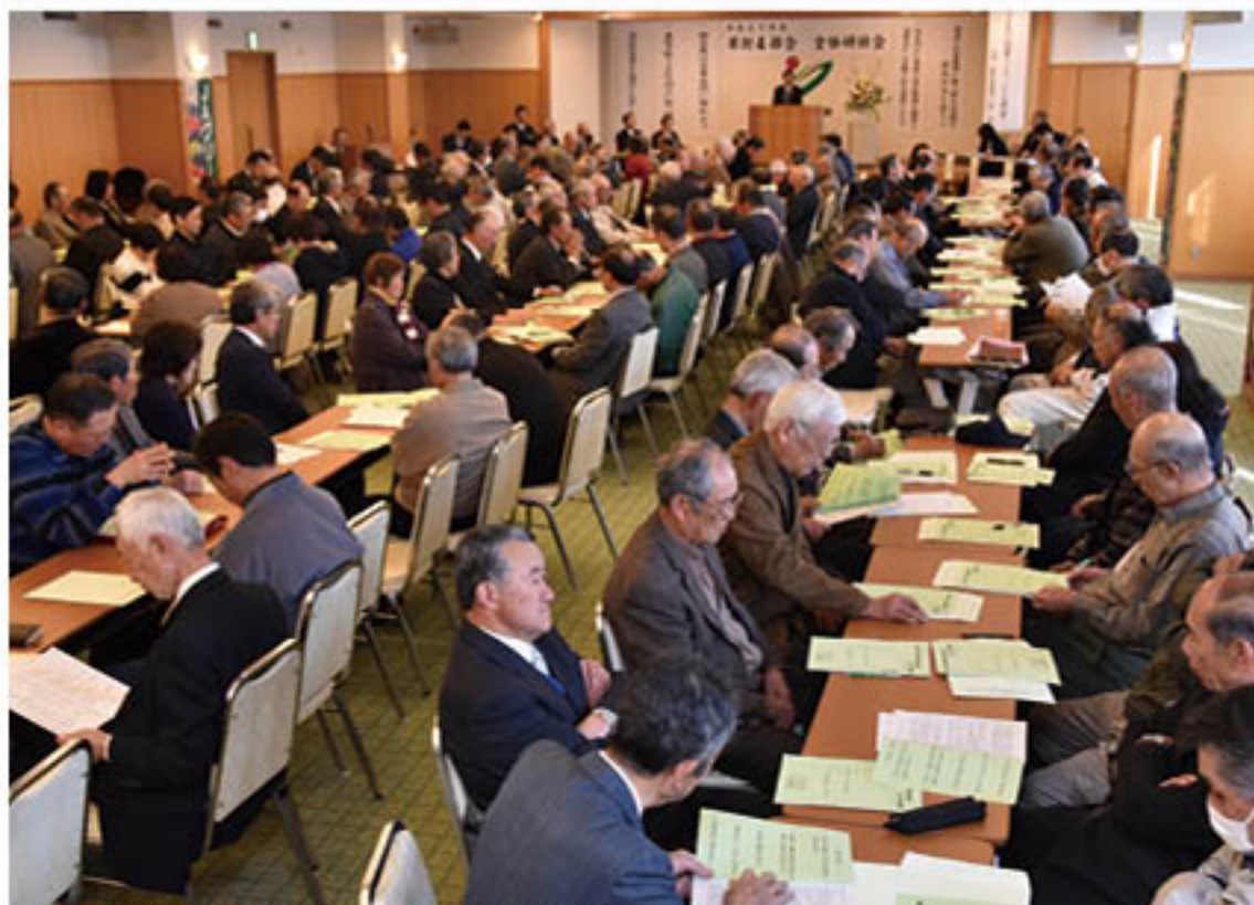
▲果樹生産者230人が意思統一する会場(果樹4部会全体総会)

J Aの果樹4部会と花き部会は3月下旬、部会役員やJ A役員が出席する中、「定期総会」を開きました。総会では27年度の事業報告や28年度事業計画、また、部会役員改選を盛り込んだ議案を審議し承認。部会一丸となった生産振興へ向けて、新たなスタートを切りました。