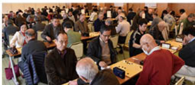
▲碁石の音が響く会場