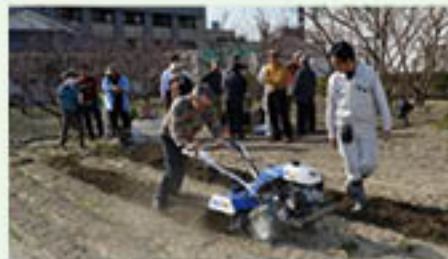
▲野菜栽培講習会の様子