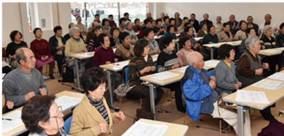
▲転倒予防のための「背筋」トレーニングを学ぶ参加者(3月15日)