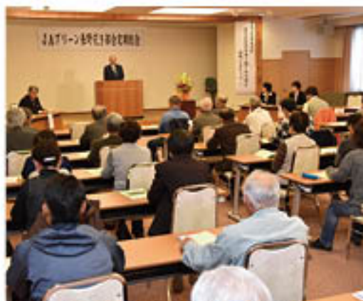
▲生産販売目標1億円達成を喜ぶ会場(花き部会総会)

花き部会は、同会場で18日に定期総会を開きました。関係者55人が出席し、念願の「生産販売高1億円達成」を喜びとともに、28年度は、出荷本数200万本、販売額1億1千万を目標とすることを確認。各専門部における栽培講習会・ほ場巡回をはじめとした栽培技術向上策や、複合栽培による新規栽培者の発掘に取り組む方針を示しました。