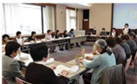
▲産生資材づくりや清掃など活動内容を振り返る参加者ら

主役はアナタ!!ページでは 女性部・青壮年部など組合員組織を中心に 輝く活動をお伝えしています!!