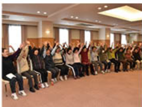
▲「イエーイ」と腕を広げて笑う受講生

JA女性カレッジは、篠ノ井のグリーンパレスで3月16日、「笑いヨガ」に挑戦しました。受講生35人が参加。受講生のうちの一人が講師を務め、「笑い」と「ヨガの呼吸法」を複合した笑いヨガの効果や、呼吸法を学びました。講師は「笑ったもの勝ち。恥ずかしがらないことが大切」と基本の心がまえを説明。受講生は、手拍子や足踏み、動物の真似などユニークな動作を交えながら、「アーハッハッハ」とお腹の底から笑いました。受講生の一人は「大勢で笑い合うことで元氣になれた」と感想を話しました。