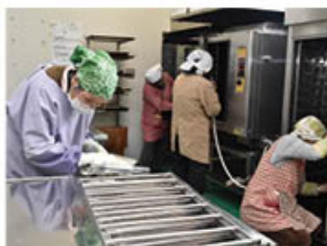
▲調理器具を丁寧に磨く部員

女性部川中島町総支部の料理班は3月11日、川中島農産物加工センターの清掃を行いました。班員25人が参加し、調理室やグループ活動用のイベントスペースなど、施設全体を隅々まで片付けました。特に調理室は、念入りに清掃。オーブンや乾燥機を分解し、丁寧に磨き上げました。この活動は、「使わせてもらいありがたい」との気持ちを伝えたいという想いのもと、5年前から毎年3月に実施。義務感ではなく自主的な参加を大切にしながら、活動を継続しています。