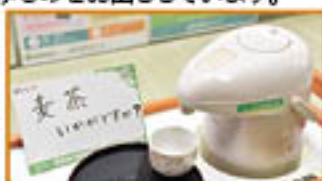
▲セルフサービスでご自由どうぞ