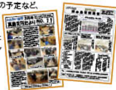
▲写真や地域の話題もたくさん！

支所長や支所職員が手づくりした支所のおしらせ「支所だより」を本誌エバーグリーンとともにお届けしています。支所だよりには、支所での催しの様子や、年金友の会の活動の予定など、組合員・地域のみなさまにより密着した話題を掲載しています。