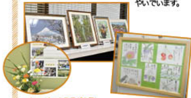
▲心のこもった作品が多数！

JA女性部部員をはじめ、JA生活文化教室などに参加されている組合員さまの作品を飾っています。組合員さま渾身の作品で、支所も華やいています。