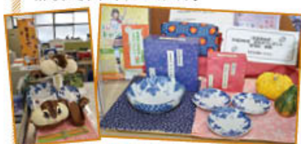
▲飾り方も支所ごとにオリジナル！

春夏秋冬にあわせた飾りで、支所内を彩ります。また、金融・共済のキャンペーン商品に合わせたポップ(ご案内)も多数！飾り方は支所それぞれにオリジナルです。