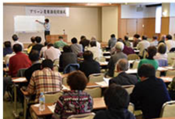
▲野菜栽培の核となる「土づくり」について学ぶ会場

宮農相談員懇談会 JAは、真島町の真島フルーツセンターで4月7日、「宮農相談員懇談会」を開きました。宮農相談員は、優れた果樹栽培技術や経営手腕を持つ生産者9人に任命。若手、定年帰農者などに向け、園地に出て技術指導などを行っています。 懇談会には相談員8人とJA役員員に加え、篠ノ井の東部青果物流通センター管内で相談員と同様に活動するもも生産者組織「東福寺OPP研究会」も参加。指導上の課題を挙げ、今後の指導方針を話し合いました。相談員は、「一善反収があがるものや必要な資材費などを具体的に示した指導が求められている」と発言。参加者は、栽培モデルを提案し、技術指導を行う方針で一致しました。