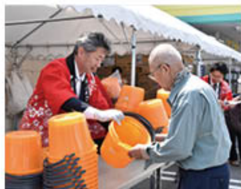
▲感謝を込めながら記念品を贈呈(アグリまつり会場)