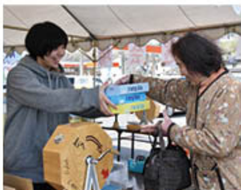
▲お楽しみ抽選会も盛況!(アグリなののい会場)

JAは、アグリ3施設で4月16日・17日、毎年恒例の「春のJA祭」を開きました。3会場では、A・コープ店内における農産物、食料品の特別価格をはじめ、JAファーム店、セルフ給油所など一体となって催しを企画。組合員みなさまへの記念品の贈呈や、お楽しみ抽選会、農産物などの特売を行いました。2日間を通して3施設には2万人が来場するなど大盛況。記念品を引き換えに来場した女性は「バケツは使い勝手がいいから助かるわ」と話し、記念品を受け取っていました。