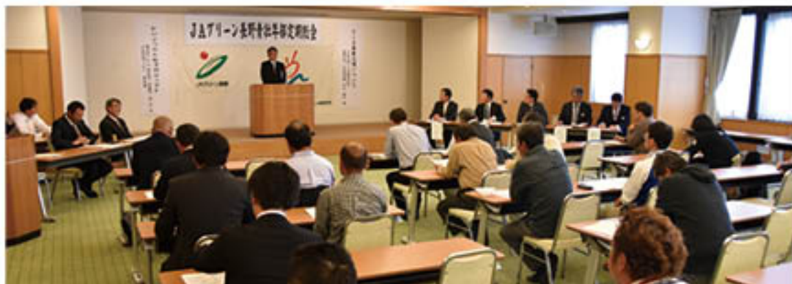
▲28年度方針を決定する会場

主役はアナタ!!ページでは 女性部・青壮年部など組合員組織を中心に 輝く活動をお伝えしています!!