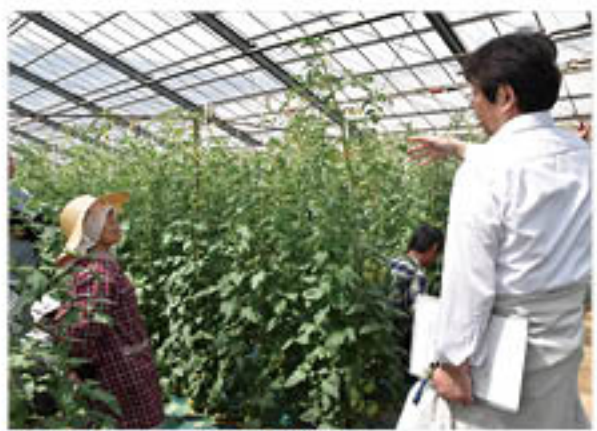
▲温度管理について説明する営農技術員

野菜部会施設果菜専門部は、松代町清野のほ場で4月14日、「トマト現地栽培検討会」を開きました。ピニールハウス施設でトマト栽培に取り組み生産者14人が参加し、生産者2軒のハウスを視察しました。定植時期や栽培方法、現状の生育状況を確認しながら、営農技術員と種苗業者が、品種による栽培上の注意点や、出荷規格などを説明。参加者は高品質なトマト出荷へ、意識を高めました。同専門部のトマト出荷は、4月20日からスタートし、2万ケース(1ケース4kg)の出荷を見込んでいます。