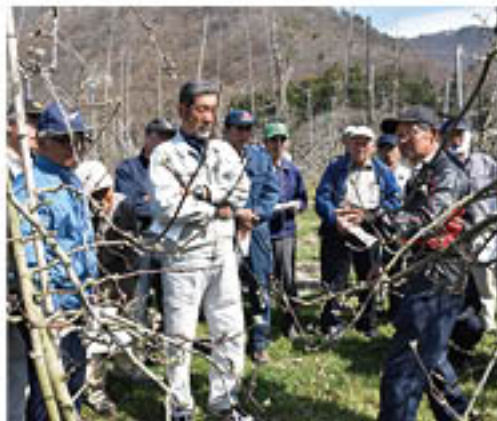
▲せん定する枝の特質について学ぶ参加者

りんご部会新しい化の会は、若穂の園地で4月6日、「せん定講習会」を開きました。「新しい化」は、りんごの省力栽培技術で、反収の増加と労力の軽減につながり、また、せん定が分かりやすいことから、担い手・高齢者にも適しています。JAでは、苗や資材費用の助成を行いながら、栽培技術の普及をすすめています。講習会には会員30人が参加。営農技術員とJA長野県営農センター担当者から、せん定の手順や要点を学びました。講師は、ポイントの一つとして、「せん定を行う時期によって樹勢が変わるので、4月から5月に行って欲しい」と説明しました。