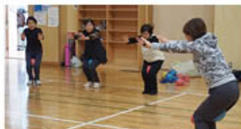
▲ソフトバレーボールを使って体操する女性部員

女性部川中島町総支部は、「女性学級」を開いています。女性学級は、総支部内で「気軽に楽しい仲間づくり」をめざして活動。健康教室や、料理教室、手話教室、アイディア教室などさまざまな教室を開き、活発に活動しています。 新年度にあわせ4月11日に「健康体操教室」が開講し、新規4人を含む12人で活動をスタートしました。体操の内容は、ソフトバレーボールを使い、心地の良い音楽に合わせて動く「ストレッチ」。無理のない動きを取り入れ、楽しく行っています。長年参加している会員の1人は、「仲間と教室で楽しくできると運動を習慣化できそうと助かっているわ」と話していました。