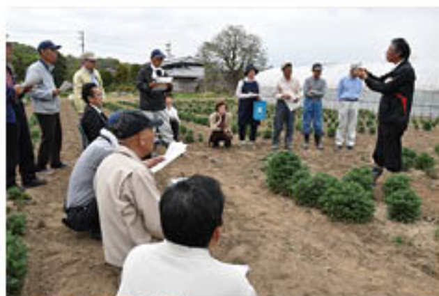
▲4月27日には現地講習会を開催

花き部会菊専門部は、東部青果物流通センターで4月13日、「コギクの栽培講習会」を開きました。部員65人が参加し、講師にJA全農長野野菜花き担当職員を招いて、栽培管理上の注意点を学びました。講師は、まず「病害防除」に意識を向けるよう説明。降雨前にタイミングを逃さず農薬散布するよう説明しました。また、県内でコギク栽培が増えてきたことに触れ、「買手の伴う産地になってきたので、品質の徹底をしっかりとってはかって欲しい」と呼びかけました。