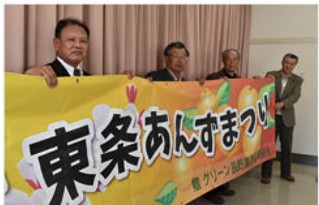
▲寄贈品を持つ神農専務とあんずまつり実行委員会委員

JA管内のあんずの一産地、松代町東条では、4月上旬の開花にあわせて「あんずまつり」が毎年開かれています。JAは今年、地域活性化を目的に祭り用の「紅白専」「横断専」を東条あんずまつり実行委員会へ寄贈。4月1日から10日までの開花期間中、会場に飾られ、彩りを添えました。また、まつりにあわせ、同町の松代農業総合センター農産物直売所では「松代のあんずの花を見に行こうフェア」を開き、旬の農産物を販売し、あんずの花を通して地域を盛り立てました。