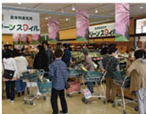
▲「グリーンスマイル」では来店客が新鮮野菜の買い物を楽しむ(アグリ南長野会場)