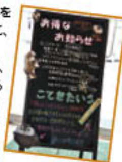
▲支所ごとに工夫がたくさん！

金融・共済商品など、新商品をご紹介します！カラフルに、イラストも入れて華やかにパッと見て、今まさに「オススメ」、また「おトク」な商品が分かるので、ご覧ください！定期的に変わるので、ぜひチェックしてみてくださいね！