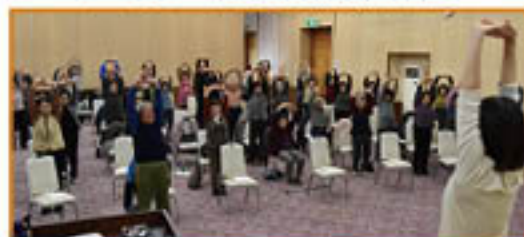
▲健康体操(27年度・更北支所)

「JAと組合員、地域住民との交流を深め、一体となった組織づくり」を目的に、全支所で「1支所1協同活動」に取り組んでいます。支所ごとに、支所祭や健康講座などを企画し、多くの組合員・地域のみなさまにご参加をいただいています。28年度も開催予定です！