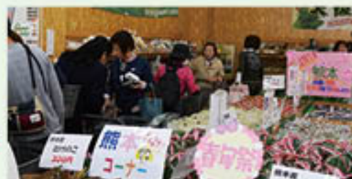
▲物の農産物が並ぶ農産物直売所内

グリーン大阪では、4月19日から、フレッシュクラブ本店(農産物直売所) にて「がんばれ!熊本フェア」を開催しました。このフェアは、4月14日 から続いている熊本周辺の地震被害に対して、大阪からいち早く、熊本を 応援しようと企画したものです。