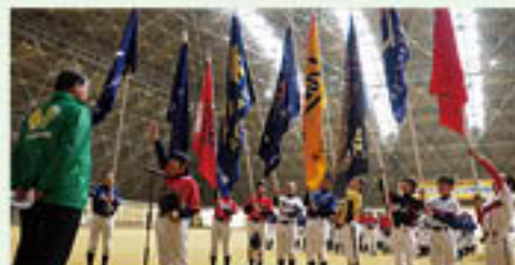
▲元気いっぱいの選手宣誓

グリーン近江は、3月5日、6日の2日間にわたり、「JAグリーン近江 少年野球スプリングマッチ2016」を開催し、地元スポーツ少年団22チ ームが参加しました。