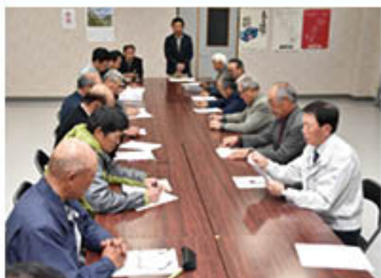
▲活発に意見を交換した相談員ら

宮農相談員懇談会 JAは、真島町の真島フルーツセンターで4月7日、「宮農相談員懇談会」を開きました。宮農相談員は、優れた果樹栽培技術や経営手腕を持つ生産者9人に任命。若手、定年帰農者などに向け、園地に出て技術指導などを行っています。 懇談会には相談員8人とJA役員員に加え、篠ノ井の東部青果物流通センター管内で相談員と同様に活動するもも生産者組織「東福寺OPP研究会」も参加。指導上の課題を挙げ、今後の指導方針を話し合いました。相談員は、「一善反収があがるものや必要な資材費などを具体的に示した指導が求められている」と発言。参加者は、栽培モデルを提案し、技術指導を行う方針で一致しました。