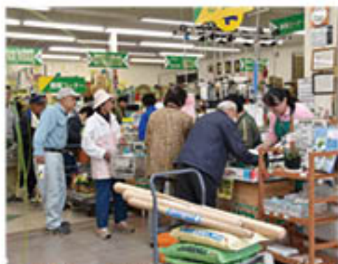
▲賑わうJAファーム店(アグリなののい会場)