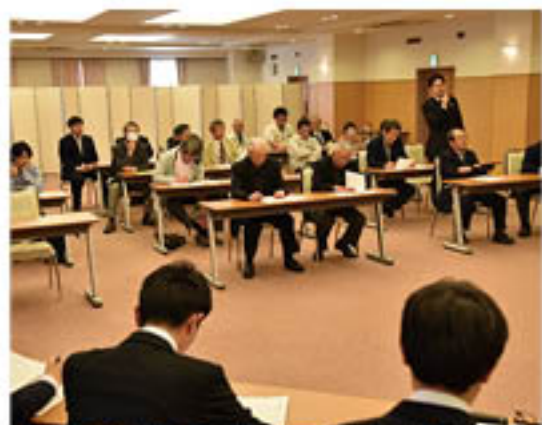
▲「資材費用削減」に努めて欲しいと要望をあげる生産者

えのきたけ・ぶなしめじ同部会は、篠ノ井のグリーンパレスで4月15日、「きのご販売促進大会」を開きました。生産者をはじめ、JA役員、JA全農長野、重点6市場が出席。産地や市場それぞれの動向をふまえた意見交換を行いました。市場は、JA管内を「きのごの有数産地」と高評価し、品質の底上げを要望。生産者は、要望を受け止め、対策の徹底を確認しました。また、生産者は高単価販売や、資材コストの削減を全農長野・JAに対して強く要請。関係者が一丸となってきのご産地維持をはかる意識を共有しました。