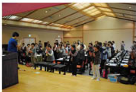
▲手を叩いて「脳の活性化」をはかる参加者

女性部若穂総支部は須坂市の温泉施設で4月21日、「お花見交流会」を開きました。この会は、部員間交流の活性化と、農作業の本格スタートを前にした「心身のリフレッシュ」、また、総支部内のサークル活動の発表も目的に、毎年恒例活動になっています。今年も75人が参加。総支部の仲間の発表をはじめ、食事、温泉を楽しみながら、趣味や農作業、女性部活動についてなど、話に華を咲かせました。さらに、会では「学習会」も開催。長野松代総合病院附属若穂病院看護師を講師に、「健康体操」を学びました。