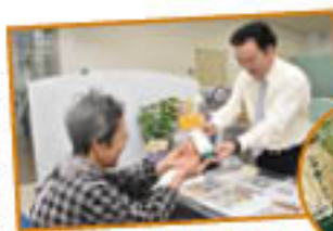
▲「ありがとうございます」と感謝を込めて農産物をプレゼント

日頃の支所のご利用やご来店に感謝して行う「ご来店感謝デー」も今年度で3年目に突入です。年金の支給日に合わせて年6回企画し、ご来店していただいたみなさま(20支所あわせて先着1,000人)に、季節の農産物や農産物加工品を贈呈しています。