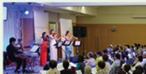
▲盛り上がった会場

グリーン大阪では、5月19日、本店4階のグリーンホールで、第14回JAふれあいライブ「スプリングコンサート」を開催し、組合員・地域住民等、約160名の参加がありました。ライブでは、懐かしの名曲やフォークソングを中心に、参加者も交えて合唱しました。参加者からは、「みんなで一緒に歌える曲がたくさんあり、楽しかった。青春時代を思い出し、明日への活力となりました」と声が上がっていました。