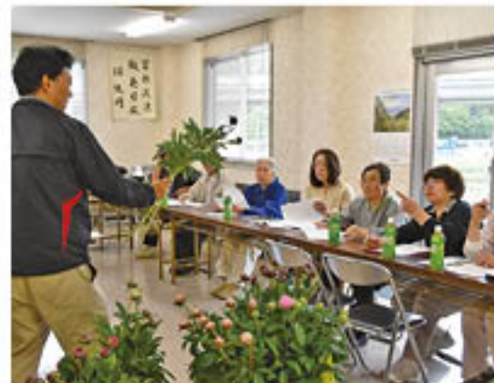
▲出荷規格を確認する生産者

花き部会シャクヤク専門部で、「露地シャクヤク」の出荷が5月7日から始まりました。生育期の高温が影響し、昨年よりも7日早くスタート。栽培者が増えた今年度は、7万本の出荷をめざしています。11日に2会場で開いた「目揃会」では、営農技術員がサンプルを前に生産者に出荷規格を説明。また、技術員は、前進出荷により、他産地との荷の集中が起こり、等階級によっては厳しい販売情勢になることも報告。荷造りの徹底を行うとともに、1本でも多い出荷で手取り確保をはかろうと呼びかけました。