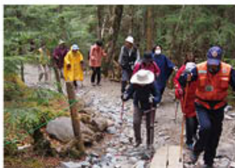
▲自然豊かなコースを歩くカレッジ生

J A 女性カレッジは、開講から3周年を記念して5月25日、ノルディックウォーキングを兼ねた「お楽しみ旅行」を行いました。会場は南佐久郡佐久穂町の八千穂高原「白駒池」と「苔の森」。カレッジ生44人が参加して、約480種類の苔が生息するという森の中を、1時間かけて歩きました。参加者は、「自然の中で非日常を感じられて、気持ちが良いわ」と笑顔。ウォーキングの後には、長門牧場で昼食。自家製の乳製品を使った料理でお腹も心も満たし、忙しい日々の束の間の休息を楽しんでいました。