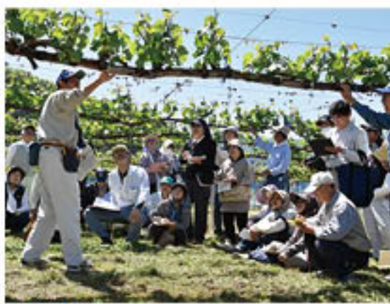
▲真剣に講義を受ける受講生

果樹栽培の初心者や定年帰農者などに向け、J Aでは今年度も流通センター・共選所ごとに「果樹セミナー」を開催し、担い手支援をすすめています。このうち、松代農業総合センターでは、長野農業改良普及センターと合同で、ぶどうの短梢栽培の基礎技術を指導する「グリーンセミナー」を5月12日に開講しました。受講生38人が参加し、松代町東寺尾のぶどう園で、芽かきや新梢管理の必要性や方法について学びました。受講生は、「学んだことを家で実践して、今後、栽培面積をぜひ増やしていきたい」と意気込みを語りました。