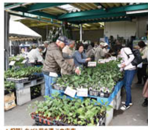
▲相談しながら苗を選ぶ来店客

J A ファーム篠ノ井・松代店では4月28日から5月8日まで、農業資材などの「統一セール」を開きました。同店舗とも夏の果菜類の苗や花を買い求める来店客で連日にぎわいを見せました。このうち、ファーム松代店の苗売り場では、新品種や定番品種など約100種類の苗が並び、来店客は苗の選び方や売れ筋品種など質問を寄せながら吟味。家庭菜園用の苗の購入に訪れた女性客は「いろいろな種類の苗を購入するのを楽しみに来た。ぜひ今年も、数種類のトマト栽培に挑戦したい」と話し、家族と相談しながら苗を選んでいました。