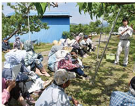
▲摘果のポイントについて説明を聞く参加者

もも部会・りんご部会では、生育の進行にあわせて「仕上げ摘果講習会」を開き、今年の生育状況や作業の確認を行っています。このうち、もも部会では5月16日から18日にかけて26会場、「仕上げ摘果・せん孔細菌病対策講習会」を開きました。篠ノ井小森のもも園で開いた講習会には30人が参加。営農技術員が、摘果作業や新梢管理、防除の徹底、今後の管理を指導しました。特に、今年県下で発生する「せん孔細菌病」については、枝先に病斑を発見次第切除することや、早めに果実に袋をかけるなど、対策の徹底を呼びかけました。