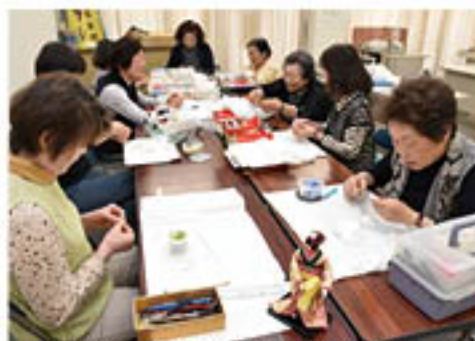
▲和紙あまい人形づくりに取り組む女性部員

女性部更北総支部「和紙人形サークル」9人は、J A 旧小島田支所で月に一度、講師の指導のもと、和紙や綿などを使った「和紙人形づくり」に挑戦しています。5月18日には、新たに「町娘」を模した人形づくりに取りかかりました。部員は、まず人形の「お顔」づくり。指先の絶妙な力を使って綿を丸め固め、顔の芯をつくりまします。芯で人形の印象が変わるとあって、「講師に確認しては丸める」の繰り返し。部員の一人は「朝ドラのあさちゃんみたいに、かわいくなあれ」と思いつくつくっているわ」と話し、作業に集中していました。