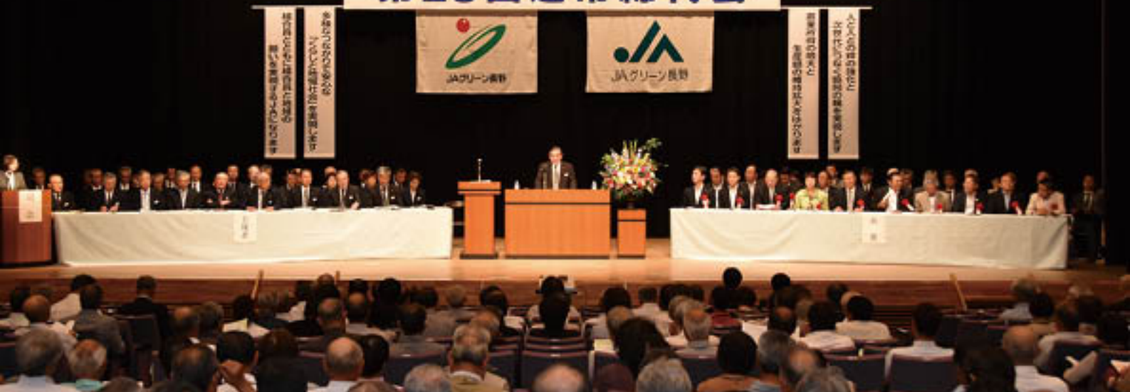
▲本人出席299人、代理人出席7人、書面出席353人で成立した第23回通常総代会

事では、第10号議案までが上程され、両議長の円滑な進行のもと、神農専務が第1号議案のDVD放映を含み議案を説明しました。出席者は、議案ごとに賛否を表明。結果、各議案とも原案通りに可決・承認されました。これにより27年度は、事業利益2億6千万円余を計上。当期剰余金5億7千万円余、経営の健全