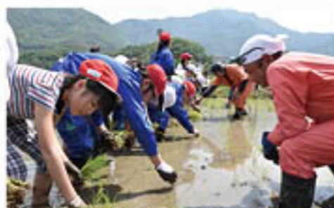
▲子どもたちを見守る青壮年部盟友

青壮年部松代支部は5月24日、松代町の長野市立東条小学校児童と「田植え」を行いました。これは同支部の恒例活動。社会科で1次産業を学ぶ5年生の児童に、「米づくり」を実験してもらい、学びを深め、農業に親しみを感じて欲しいと協力を続けています。この日は、児童36人と青壮年部盟友3人が参加。盟友が稲の持ち方や植え方を伝えたのち、さっそくみんなが目印のひもにあわせ、等間隔で植えていきました。笑顔で楽しそうに苗を植える児童の姿に、盟友は「米づくりの大切さを学んで、ぜひ農業に挑戦してもらえると嬉しい」と話しました。