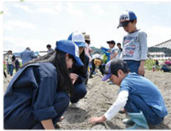
▲馬鈴薯の植え付けに児童と見守る高校生

J A は、今年度も J A 管内在住の小学生とその保護者を対象にした「親子ふれあい農業塾」を開講しました。20組が参加し、営農技術員が講師を担当。また今年度は、長野県更級農業高等学校3年グリーンライフ科アグリネットワークコース24人が講師補助として作業に初参加します。第1回講座は、篠ノ井東福寺のほ場で5月14日に開催。児童は、草取りをはじめ、高校生に手ほどきを受けながら、畝立てや馬鈴薯の植え付け作業を行いました。馬鈴薯の植え付けに初挑戦する児童は、高校生に植え方のコツを教わりながら、丁寧に作業をすすめていきました。