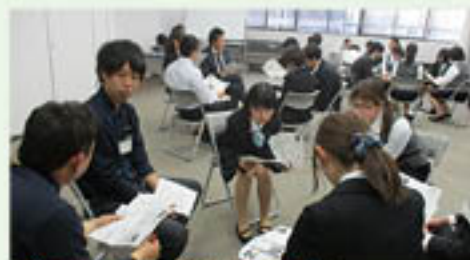
▲活発に自分の意見を述べる参加者たち

グリーン近江八幡東支店は、4月20日の業務終了後、役職員の行動規範である「グリーンウェイ」による人間力向上を目的とした研修会「木鶏会」を開催し、職員約30人が参加しました。本店で平成26年度に読書会として始めたもので、今年度から同支店でも取り組むこととなりました。