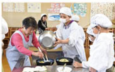
▲児童にいらせんべいの焼き方を伝授する女性部員

主役はアナタ!!ページでは 女性部・青壮年部など組合員組織を中心に 輝く活動をお伝えしています!!