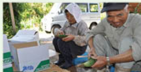
▲収穫済みゴーヤーを選別作業で確認する川畑さんご夫婦

グリーン鹿児島市の吉田南スタミナチャンピオン生産者部会では、2016年産のゴーヤーの収穫が始まりました。