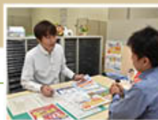
▲篠ノ井ローンセンターでは、随時相談受付中