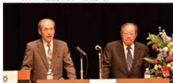
▲円滑な議事をすすめる議長