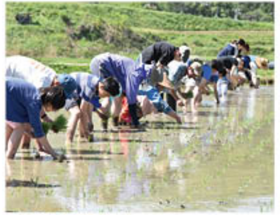
▲苗の手植えに取り組み参加者

J A は、今年も J A 長野県グループの「国際協力田運動」に参加し、食料不足に苦しむ国へ「支援米」を贈ります。田植えは5月8日、篠ノ井信里にある12アールの国際協力田で行い、同地区「若林むらおこし会」と J A 若手職員、長野市茶白山動物園「カエルサポーター」の親子連れが参加しました。参加者は田の中で横一列の等間隔に並び、目印のひもに合わせて苗を植え付けていきました。常連の参加者も多く、スムーズに作業がすすみ、1時間ほどで終了。参加者は、「海外に届ける米がたくさん実ればいい」と話していました。