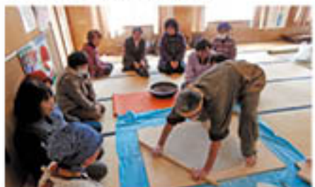
講師の実演を見る支部員

女性部松代総支部豊栄支部は、松代町の豊栄公民館で1月30日、「そば打ち」の技を次世代に残していこうと、そば打ち講習会を開きました。