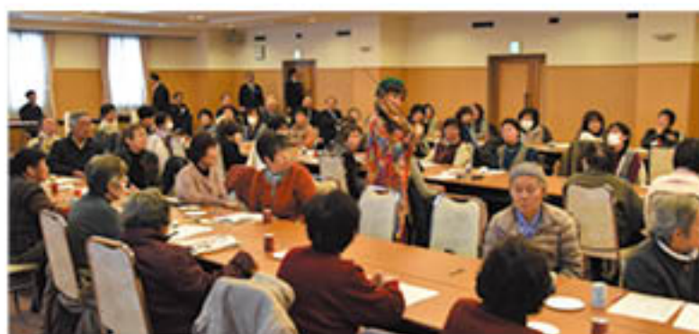
りんご部会では研修のほか、ヴァイオリンの演奏を楽しむ(1月30日)

このうち、花き部会は2月15日に千曲市内の旅館で、「花き栽培のあるある、「豆知識」をテーマに研修を行いました。研修では花き栽培にまつわる知識をクイズ形式で解きながら理解を深めました。また、温泉や食事を通じて参加者間で交流し、笑顔あふれる時間を過ごしていました。