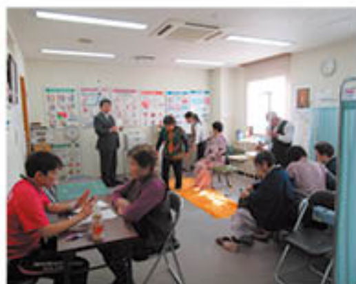
健康診断や相談コーナーで身体の状態をチェック

J Aは、上水内郡信濃町のホテルアステイクろひめで2月14日から17日まで、「黒姫集団保養」を行いました。これは組合員の健康増進を目的に3泊4日で企画しています。今年は80人が参加。ホテルでは、健康診断をはじめ、ゲートボールで身体を動かしたり、意語を歌ったり、手芸にも挑戦しながら、心身のリフレッシュをはかりました。毎年参加する組合員の一人は、「1年ぶりに友人に再会できたり、ゆったりとした時間を過ごせる」と話し、周囲との交流も楽しんでいました。