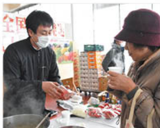
トマトミネストローネをすすめるJA職員

農産物加工品をPR A・コープファーマーズ南長野店で2月5日、JA長野県農産物直売所イベント「JAさんさん産直の日」を開きました。直売会員やJA生産販売部が参加し、ジャムなど農産物加工品の試食をふるまい、多くの来場客が味を確かめながら生産者自慢の一品を購入していました。このうち営業課では、「トマトミネストローネ」や「ジャム」を宣伝。スープを試食した女性客は「手軽にトマトや野菜の風味が楽しめて良いわね」と話していました。