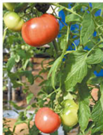
色をつけて味をのせてから収穫