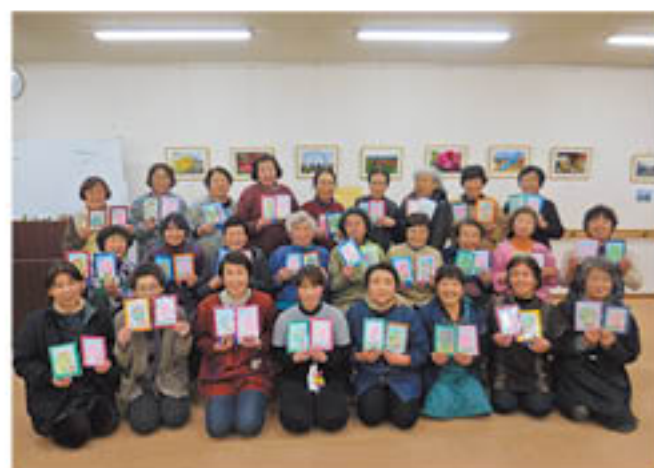
できあがった2作品を持って笑顔で撮影