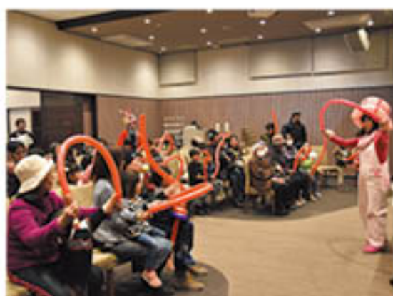
来場客もパルーンアートに挑戦

J A虹のホール松代は、多くの組合員・地域住民に施設を知ってもらおうと、新装オープンから1周年にあわせ、「虹のふれあい祭り」を2月4日に開きました。葬儀会場では、映画の上映会やパルーンアート、法要会場ではミニ緑日を行い、子どもから大人まで多くの来場客がイベントを楽しみました。女性客は「日常的に訪れる施設ではないので、施設内を見る良い機会になった」と話し、J A職員にホールの規模や収容人数について質問を寄せていました。