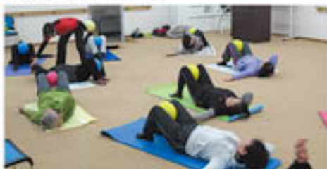
ボールに乗って体幹の筋肉を鍛える12人の参加者

組合員の健康増進を目的とした組合員健康企画は、コミュニティプラザ川中島で2月17日、「体幹トレーニング」を行い、「ビューティースタイル」をめざして体を動かしました。