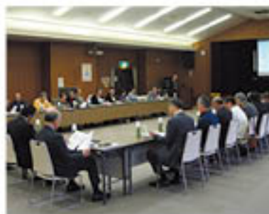
グリーン近江の概要について説明を受けるグリーン大阪役員ら

グリーン大阪の役員24人は2月17日、大阪府外視察研修として、グリーン近江を訪問しました。