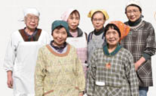
東北郷土部 ゆりの会の みなさん