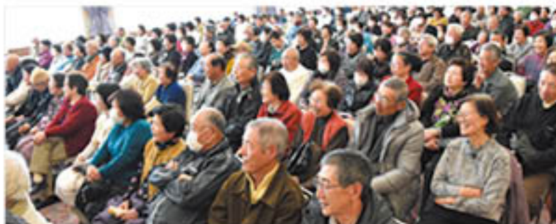
大きな笑いに包まれる会場

J A年金友の会と女性部は2月6日、稲里町のグリーンホールミナミで「新春きずな寄席」を開きました。「初笑いで春よ来い 福も来い」をテーマに、今年で6回目の開催。会員ら205人が来場し、北安曇郡松川村を中心に活動する「まつかわ落語会」と市内の信濃家一門所属のアマチュア落語家4人の軽妙な「口演」を楽しみました。毎年来場するという男性は、「プロのような斬を聴くことができ、体が温かくなるほど笑えた」と感想を話していました。