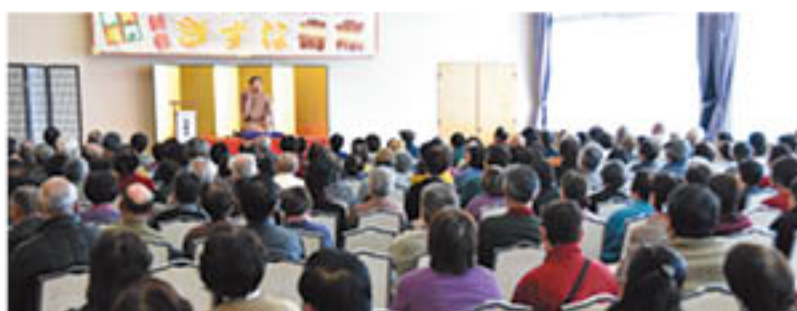
高座に視線が集中