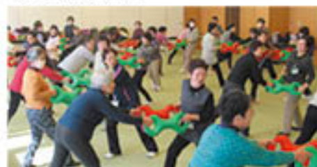
「ベル」を使った体操に受講生47人が挑戦

JA女性カレッジは、篠ノ井のグリーンパレスで2月1日、「ボール」「ベル」「ベルダー」という頭文字にBの付く3種類の用具を使った「3B体操」に挑戦し、楽しみながら行う有酸素運動で健康増進につなげました。