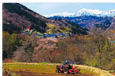
表 賞 優良賞