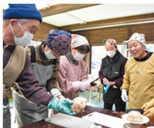
「皮はこれくらいむけば良い？」と確認する参加者

J Aが運営する長野市大岡特産センターで2月14日、「冬期講習会」を開きました。来客が減る冬場にイベントを企画し、多くの人に施設を訪れてもらうことを目的に不定期で開催。今回は、地元の生産者が講師を務め、長野市内外から参加した11人に、直売所に並ぶ「こんにやく芋」を使用し、こんにやくの作り方を指導しました。市外から参加した男性は「たまたま立ち寄った時に企画のポスターを見て興味を惹かれたので嬉しい」と話しました。