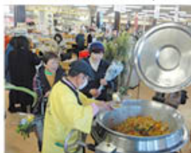
ちゃんこ鍋の振る舞いに「おいしそう」との声が集まる

グリーン近江農産物直売所「きてか〜な」は、正月を来店者とともに祝おうと、1月7日から9日までの3連休に迎春新年祭を開き、3日間で約1万人の来店客で賑わいました。