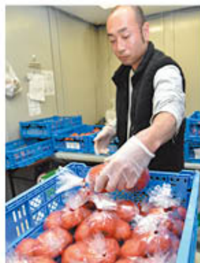
直売所に出荷するトマトを丁寧に荷づくりする