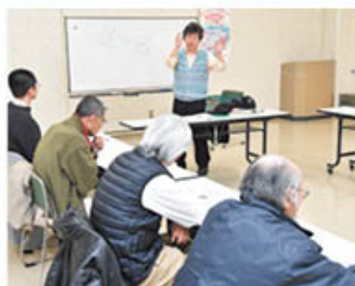
土づくりについて説明する営農技術員

野菜部会は、新たに野菜づくりに挑戦し、共選出荷をめざす仲間を増やそうと2月22日、篠ノ井の営農センターで「野菜の栽培と出荷説明会」を初めて開きました。定年を目前に、本格的に野菜栽培の導入を検討する人などが参加する中、野菜担当の営農技術員が、J Aの振興品目で初心者でも導入しやすい「ジュース用トマト」をはじめ、「ピーマン」などの果菜類、また野菜栽培の基礎となる「土づくり」について説明。時折参加者から寄せられる質問にも答えながら講習をすすめました。