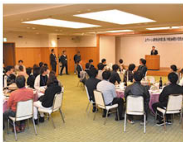
病院関係者のあいさつを聞く会場