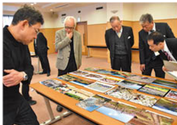
審査のポイントを確認する審査員

J Aでは、管内の農業や地域の伝統を次世代に伝えようと、28年度も「フォトコンテスト」を企画し、組合員や写真愛好家から作品を募集しました。5回目となる今回は、23人から103作品の応募がありました。審査会は、篠ノ井のグリーンパレスで2月6日に開催。J A役員のほか、全日本写真連盟やプロ写真家など9人の審査員が構図や撮影者の意図が伝わるかなどを厳正に審査し、入選12作品が決定しました。入選作品は今月号の本誌より順次表紙を飾り、地域の魅力の再発見につなげていきます。