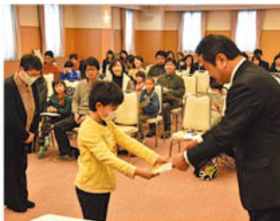
修了証を受け取る子ども

J Aが更級農業高校と開く「親子ふれあい農業塾」の閉講式を2月18日、篠ノ井のグリーンパレスで開き、塾生12組と高校生が参加しました。講師を務める高校生が卒業を迎えるため、今年度の塾は例年より1カ月早く閉講を迎えました。式では、子どもたちが修了証を受け取ったほか、高校生が塾を通じて学んだことを発表し、塾を締めくくりました。J Aの担当者は、「ぜひこれからも地域の農業に興味を持ち続けて欲しい」とメッセージを送りました。