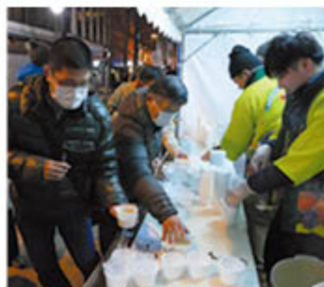
あたたかい「灯明なべ」に手を伸ばす