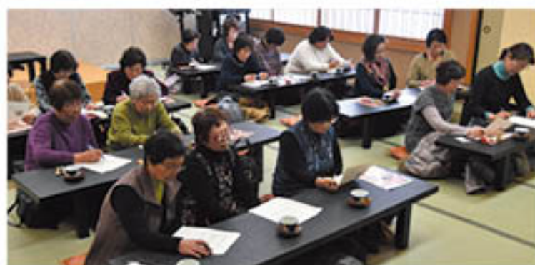
問題を解き、花き栽培の知識を深める参加者(花き部会)

花き部会とりんご部会は、女性の生産者を対象にした「冬期講座」を開きました。両部会とも農作物の生産において活躍する女性の労をねぎらうとともに、女性同士で交流を深めて情報を共有することで、さらに生産意欲を高めて農業に取り組んでもらうことを目的に、毎年開いています。