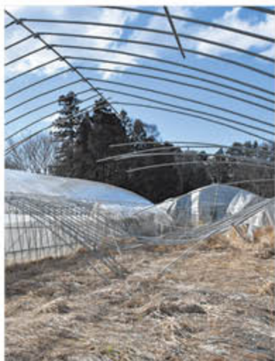
現状半分までですすんだという再興作業中のビニールハウスの基礎