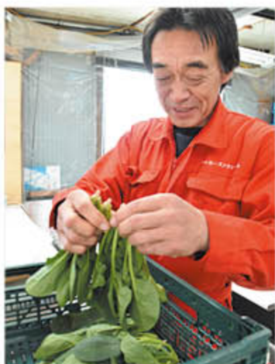
直売所出荷用にとハウレンソウの荷造り作業をすすめる