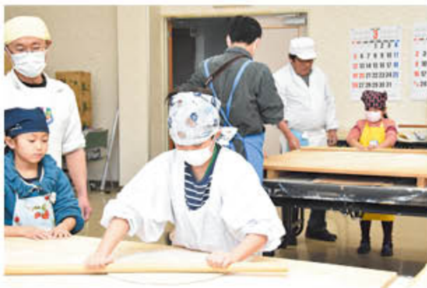
均等な厚さに生地を伸ばす参加者

小学生親子が参加する「親子ふれあい農業塾」を3月11日、篠ノ井の営農センターで開催しました。今回は塾閉講後の番外編授業。親子と更級農業高校卒業生が、そば打ちグループ「そば打ちま専科」からそば打ちを教わりました。参加者は4班に分かれて、生地をまとめてこねる・伸ばす・切る作業に、力をあわせて挑戦。保護者は「地元のそば粉でそばが打てるなんて嬉しい」と話し、親子そろって楽しんでいました。