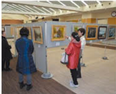
様々な作品が展示された組合員作品展

グリーン大阪では、3月15日から18日まで本店4階グリーンホールで、「第19回組合員美術作品展」を開催しました。組合員116人が、絵画・書道・写真・手芸作品など、幅広い作品180点を出品。来場者は、553人を数えました。