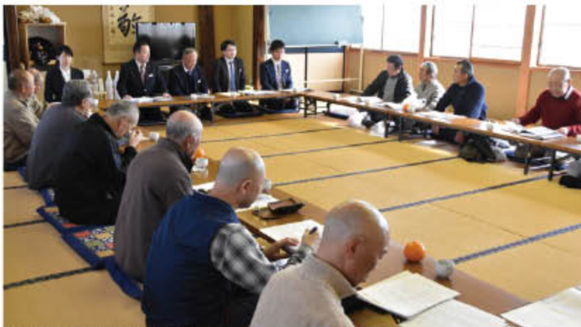
▲共和支所管内地区懇談会