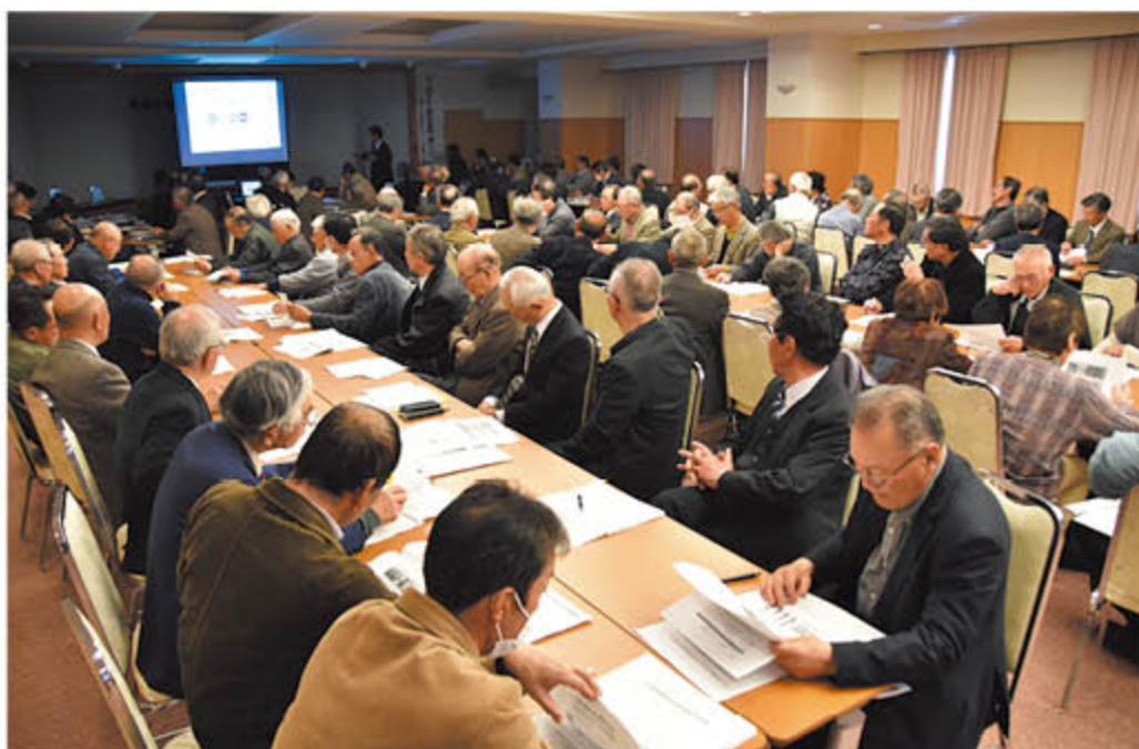
「GAP」について真剣に学ぶ会場

J Aの果樹4部会と花き部会は3月中下旬、篠ノ井のグリーンパレスで「定期総会・研修会」を開きました。各総会では、28年度の事業報告や29年度の生産販売計画を盛り込んだ議案を審議し、承認。研修会では、「安全安心な農業生産」へ学びを深めました。