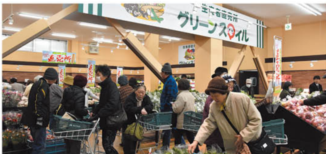
新鮮野菜が豊富にならぶ「グリーンスマイル篠ノ井」