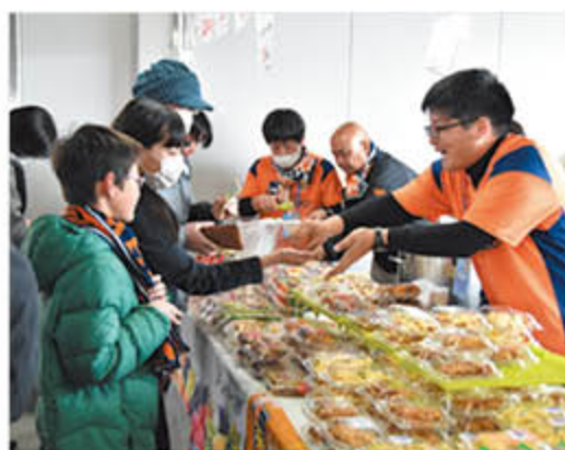
各種飲食物を販売し、JAをPR

J Aは、今年も地元サッカーチーム「AC長野パルセイロ」のプロモーションサーを務め、農産物やJ A事業を幅広い世代にPRしていきます。