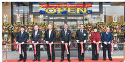
開店を祝ってテープカット

JAは、篠ノ井のA・コープ篠ノ井店を全面改装し、新たに「A・コープファーマーズ篠ノ井店」と名称を変えて、3月24日にリニューアルオープンしました。店舗内は、旧店舗の約3倍の面積となった直売所「グリーンスマイル篠ノ井」が設けられたほか、店舗設備も更新。取扱商品数を増やすとともに「まごころを込めたサービスマン」で地域に愛される店舗をめざします。