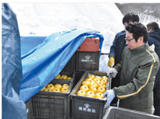
雪中貯蔵りんごを選びだす職員

生産販売部は3月8日、大岡の雪中に貯蔵していた雪中貯蔵りんごを掘り出しました。この日掘り出した量は「サンふじ」25ケース、「シナノゴールド」15ケース。雪を重機で崩し、ブルーシートを開けると、甘い香りが一面に広がりました。試食した職員からは「みずみずしく、味が濃縮されてさらにおいしくなっている」と貯蔵に手応えを感じていました。貯蔵品は、付加価値を高めたブランド品の一つとして、各イベントなどで販売していきます。