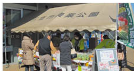
店舗前にブースを構えて販売

青壮年部とJ A生産販売部営業課は、3月11日・12日、東京都三鷹市のJ A東京むさし三鷹緑化センターで「雪中貯蔵りんご」を中心に農産物や加工品を販売し、J Aや青壮年部活動をPRしました。