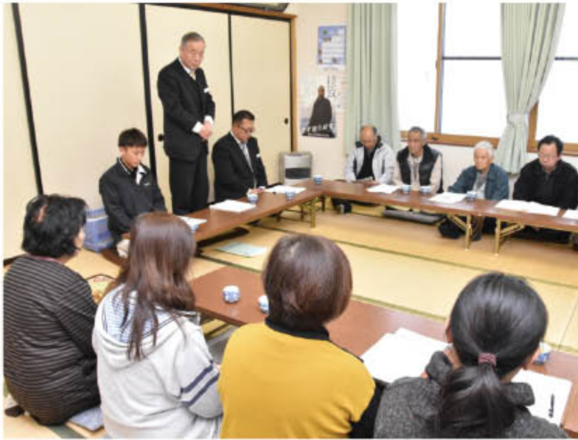
▲更府支所管内地区懇談会

懇談会では、JA自己改革の実践状況を含む28年度の事業報告、29年度の事業計画案を説明し、みなさまからご質問やご要望などのお声をお寄せいただきました。今回の特集では、みなさまのお声について、JAの回答を掲載いたします。