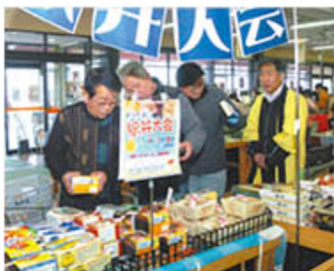
賑わいをみせる「きてか〜な」内 駅弁売場

グリーン近江農産物販売所「きてか〜な」は2月25日、特設売り場で「駅弁大会」を開き、土曜日とあって大勢の来店客で賑わいました。