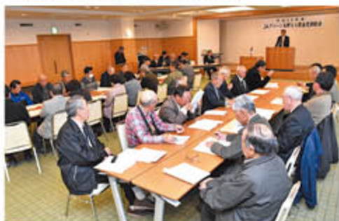
研修会を前に開いた「もも部会定期総会」

神農組合長は、研修会にあわせて今後の方針を示し、「部会と話し合いながら生産者負担を減らすための施策をすすめていきたい」と話しました。