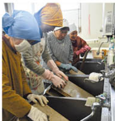
オーブンを分解して清掃する部員

女性部川中島町総支部女性学級料理班は3月14日、JA中津支所隣の農産加工施設「川中島加工センター」を清掃しました。組合員はじめ地域住民も利用する施設を、利用者が気持ちよくキレイに使えるよう、感謝の気持ちを込めて、毎年3月に清掃活動を実施。加工室に限らず、施設全体を隅々まで磨きました。班の代表は、「班員が自主的に参加して気持ちを込めて掃除することで、気持ちよく施設を使えるので、ぜひこれからも続けていきたい」と活動継続に意欲を見せました。