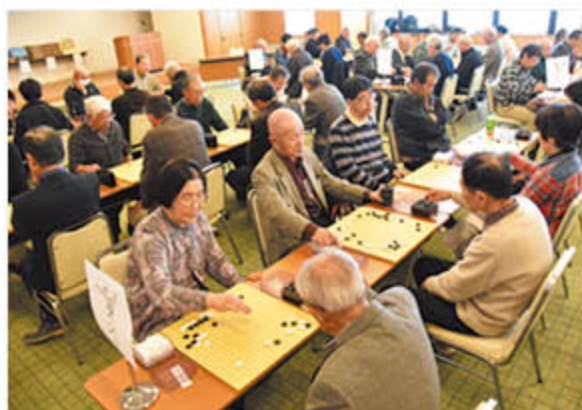
熱戦が繰り広げられる会場

J Aは篠ノ井のグリーンパレスで3月5日、「第18回長野南地区アグリ杯囲碁大会」を開きました。大人や子ども96人が出場し、6ランクに分かれて碁盤上の熱戦を繰り広げました。