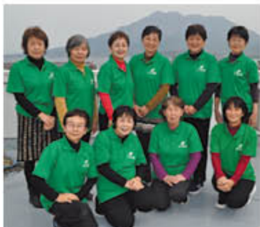
絆ポロシャツで復興を願う 女性部支部長たち

グリーン鹿児島女性部は、東日本大震災の復興を願い、平成23年秋から「絆チャリティウォーク」や募金箱の設置、「オリジナル絆ポロシャツ」の販売に取り組み、支援活動の輪を広げています。