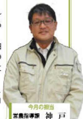
今月の担当 営農指導課 神戸