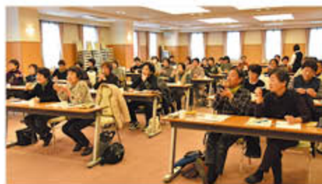
歯ブラシを持ち手を動かしながら確認

J A女性カレッジは、篠ノ井のグリーンパレスで3月16日、歯みがき粉メーカーを講師に歯みがきのコツなどを学びました。受講生は「ながらみがきでも良いので、夜寝る前の歯みがきは時間を長めに、入念に」と教わり、さっそく実践を誓っていました。