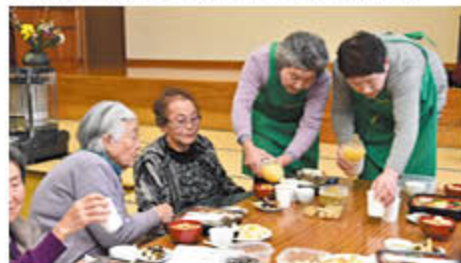
特製のりんごジュースも配る会員

女性部若穂総支部役員OBや有志による「若穂助け合いの会」は若穂地区で2月23日、「お茶のみサロン」を開きました。70歳以上の地域住民を招き、演芸発表や持ち寄った野菜でつくる「助け合い汁」を提供し、高齢者とふれあいました。