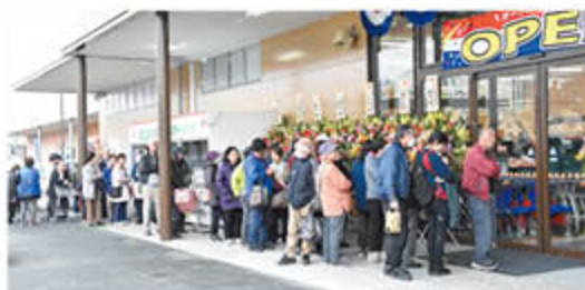
開店前から大・大・大行列