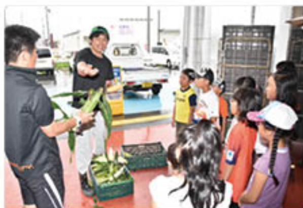
トウモロコシの特徴を説明する青壮年部