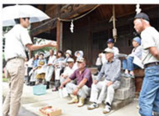
出荷規格を確認(川中島町今井神社会場)

もも部会は、7月24日から26日に14会場で開催講習会を開き、「正品率向上」へ意思統一をはかりました。