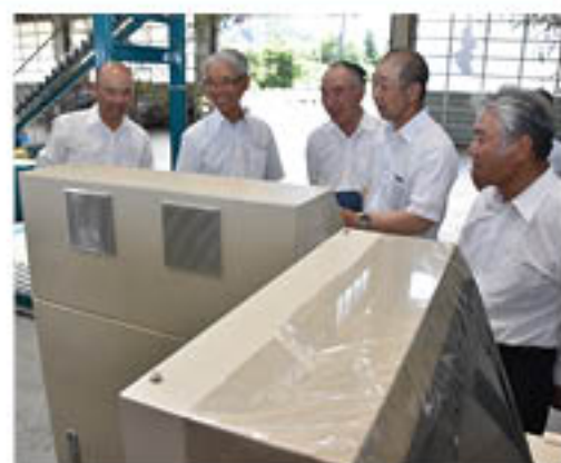
新しくなった機器を確認する生産者

若穂の若穂果実流通センターでは、果実選果機の「光センサー」を更新し、7月6日に更新工事竣工・安全祈願祭を行いました。果実の糖度や熟度を測るセンサーが「透過式」となり、精度向上による高品質な果実の出荷へとつなげていきます。祈願祭では、神農組合長が「今日を契機に、流通センターの一層の発展を地域とともにすすめたい」とあいさつ。生産者は「より消費者に喜ばれる農作物を届けることができれば嬉しい」と話しました。