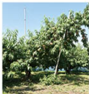
大草流で仕立てたももの樹