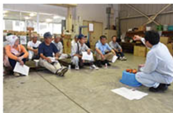
外観で判断し完熟出荷を要請する業者

本格出荷を前に、松代町の松代農業総合センターで21日、講習会を開き、16人が出席。契約業者担当と営農技術員は、果実の外観が「黒に近い赤」になるのを「完熟」の目安として、完熟品の収穫をめざすよう呼びかけました。