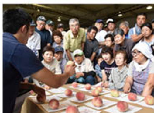
地色を確認(東部青果物流通センター会場)