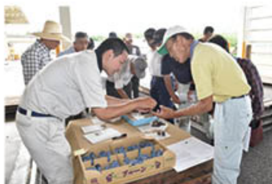
荷造りの注意点を確認する生産者

新興果樹部会ブルー専門部では、ブルー「アーリーリバー」の出荷が7月12日から始まりました。本格出荷に向けて14日に4会場で開催講習会を開き、若穂の若穂果実流通センター会場には14人が出席しました。営農技術員は、「見た目による熟期の判断が難しいため、自分が食べておいしいと感じることを判断材料の一つにして欲しい」と説明し、「適熟出荷」を呼びかけました。