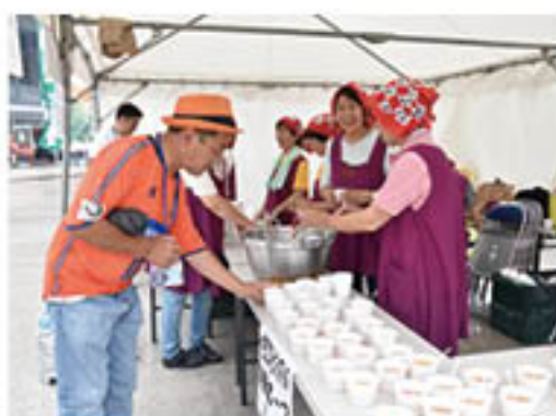
特製スープをふるまう女性部

J Aは、篠ノ井の南長野運動公園Uスタジアムで7月23日、A C長野パルセイロ対F C琉球の試合の「冠スポンサー」を務め、農産物やJ A事業のPRを行いました。会場では、選手へのももも贈り物や来場者へのネクタリンの配布、女性部によるスープのふるまひなどを行い、会場を沸かせました。