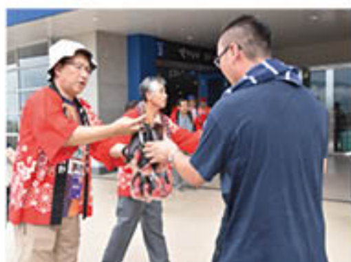
来場者にネクタリンを配布