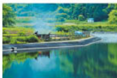
表 賞 佳作