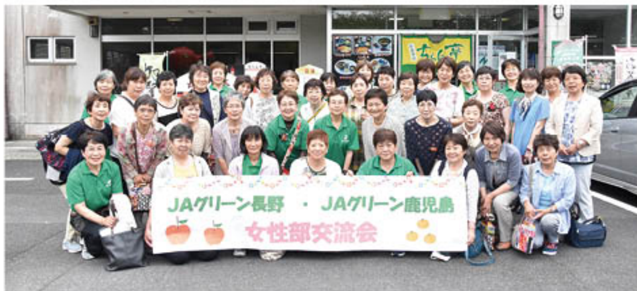
交流会記念に両女性部で写真撮影

今年度の女性部本部役員と過去3年間に役員を務めた部員総勢28人は、7月11日から13日まで、県外研修旅行として鹿児島県を訪れました。「グリーンコネクト」の協定先で、同県内でも活動が盛んな女性部として表彰される「グリーン鹿児島女性部」との交流・意見交換会が目的。鹿児島女性部から、本部役員ら10人が出席し、食事を囲みながら、多くの女性部で課題となる部員の「高齢化」や「減少」の解消策について、鹿児島女性部が取り組む具体策などを聞きました。