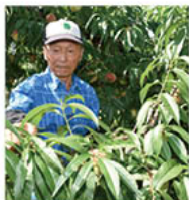
葉摘みの作業をすすめる