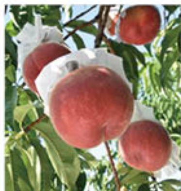
出荷間近の「なつっこ」