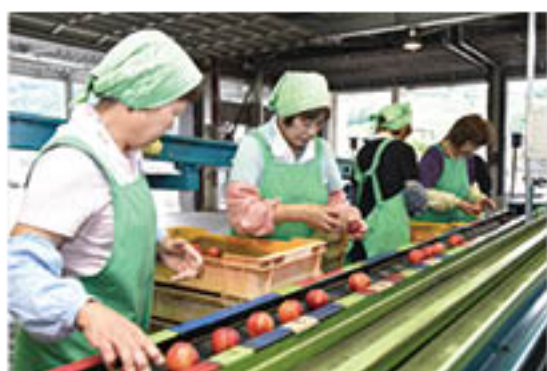
選果機にネクタリンを流す従業員

主力品種の「メイグラウンド」は7月中旬に本格化し、県内外各地へと連日出荷されています。