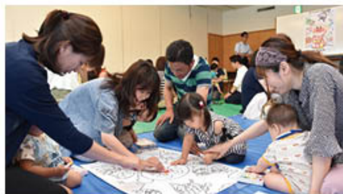
みんなでアンパンマンに色をつける