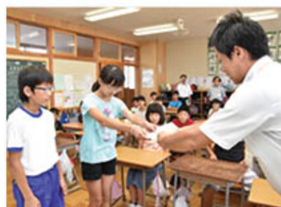
「地元の農産物をぜひ食べてね」とハガキを贈呈

J Aは、日本郵便長野南郵便局と連携し、小学校23校に「かもめくる」計1400枚を贈呈しました。ハガキにも「もやりんご」などの農産物と、「人と人との絆 次世代につながる協力の輪」というメッセージを印字。地元の農産物に親しみを感じてもらうとともに、地元の農産物にのせて子どもたちの気持ちが送付先に届くようにとの意を込めています。 7月21日は、J A職員が長野市立昭和小学校5年生のもとを訪れ、児童にハガキを手渡しました。