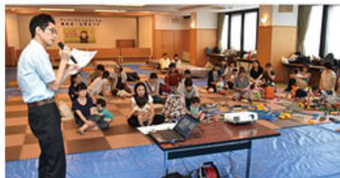
子どもの病気やケガへの対応を学ぶ参加者

J Aは、1歳以下のお子様がいる保護者を対象に、「第3期J A共済アンパンマンこどもくらぶ」の会員を募りました。次世代層との「絆づくり」を目的とし、今期は68会員が入会。2年間の会員期間中に、イベントの開催や、J Aのさまざまなサービス・情報をお届けしていきます。 発足にあわせ、今期初イベント「七夕まつり」を篠ノ井のグリーンパレスで7月21日に開催し、19会員43人の親子が参加しました。イベントでは、南長野医療センター篠ノ井総合病院看護士の講話を聞いた後、グループに分かれて「アンパンマンのゆりえ」や、ネムタリンなどが並ぶ「お茶会」を行い、会員間やJ A職員との交流を楽しみました。会員の一人は、「看護師さんの話はとてもためになったし、他の会員の方ともお話ができ、とても楽しく過ごすことができた」と感想を話していました。