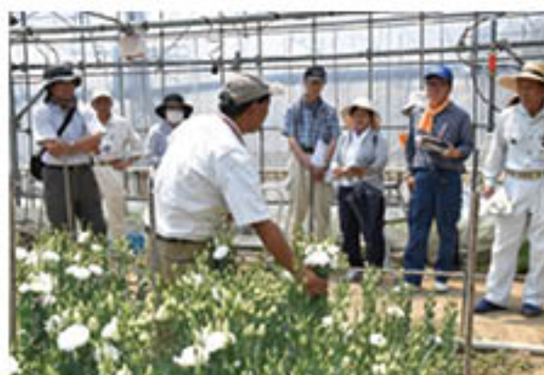
トルコギキョウのほ場を見学する受講生