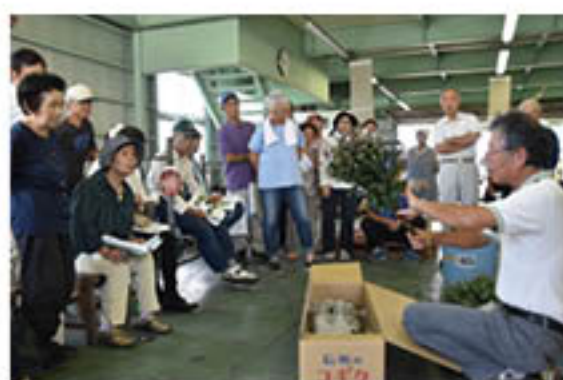
荷づくり方法を学ぶ生産者

花き部会菊専門部で、益需要にあわせた「コギク」の出荷が7月22日から始まり、同日、篠ノ井の東部青果物流センターで目合わせ会を開きました。2部に分かれて生産者60人が出席し、営農技術員やJ A全農長野講師が、出荷規格や労力軽減となる荷づくり方法などについて説明。品質・手取り向上をはかりました。生産者の一人は、「教わったことを忠実にやって、1本でも多く出荷していきたい」と意気込んでいました。