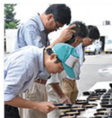
検査をすすめるJA農産物検査員