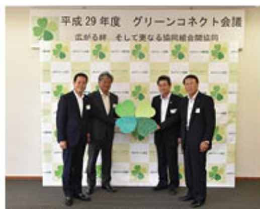
絆の象徴「クローバー」を持ち結束を確認

29年度は、J A自己改革の実践とともに、農畜産物の販売協力や人的交流の活性化で「グリーン」の絆を発展させていくことを確認しました。