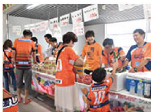
キュウリやネクタリンなどを販売したJAブース