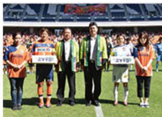
両チームにぶどうを贈呈