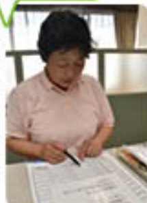
受付表に記入します

まずは、申込受付先へ行き、希望日時が空いているか確認しましょう。空いていたら、さっそく予約しましょう。