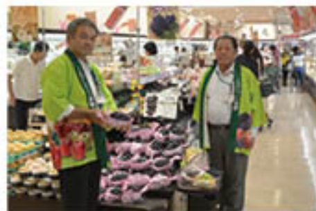
「ナガノパープル」を宣伝

青壮年部は、神奈川県横浜市のスーパーマーケット2店舗で9月16日、「ナガノパープル」の宣伝会を行いました。