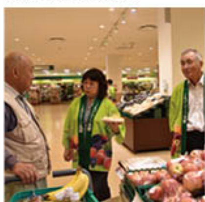
消費者と交流する部会員

りんご部会信更支部は、青木島のスーパーマーケットで9月23日、りんご「シナノドルチェ」を宣伝しました。