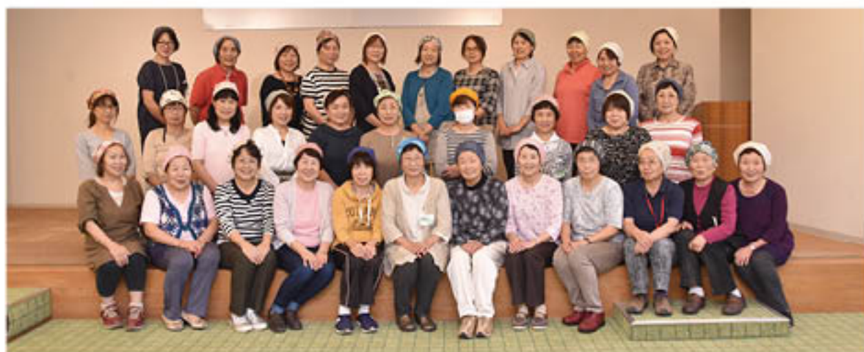
つくった「ちょいかむり」をかぶり記念撮影