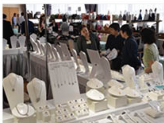
販売員から説明を受ける来場者

J Aは、組合員・地域のみなごまの「くらし」への貢献を目的に、9月6日から8日まで、稲里町のグリーンホールミナミで、「生活総合展示会」を開きました。会場では、宝飾品や訪問着や紳士服などの衣料品、寝具やゴルフセット、A・コープマークの食品など、さまざまな商品を展示販売しました。来場者は、販売員に説明を聞き、試着や試食をしながら購入を検討。また、売り場を巡るスタンプラリーに挑戦し、記念品を受け取るなど、買い物を楽しんでいました。