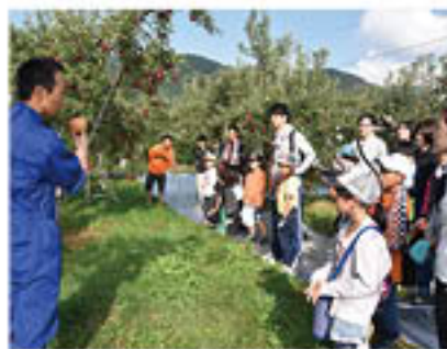
りんごの特徴を説明する青壮年部員