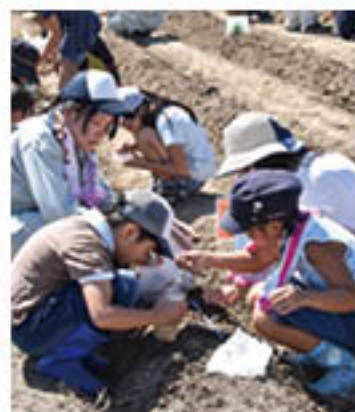
ダイコンとカブの種まきに挑戦

J Aが更級農業高校と開く「親子ふれあい農業塾」を篠ノ井のは場で9月9日に行いました。