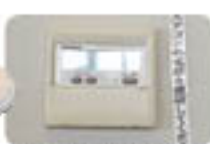
エアコンは各自で調節を