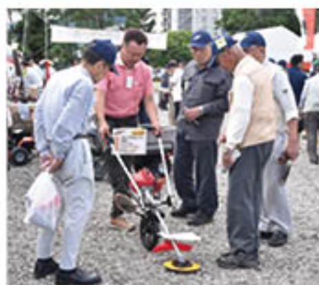
メーカーから説明を受ける来場者

JAでは、支所ごとバス15台で組合員約750人を送迎。農機センター職員が、来場客の希望にあわせて会場内を同行し、農機の説明などを行いました。男性客は「歳をとると機械が絶対に必要になる。いろいろ見比べて購入を検討したい」と話し、質問を寄せていました。