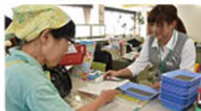
明細書を提出し料金を支払います

出入り口の鍵をかけ、鍵を利用受付先に返しましょう。利用受付先では、利用明細書を提出し、料金は現金で会計してください。 ★15時を過ぎそうな場合は先に会計を済ませてくださいね。