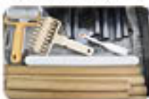
機器の元栓を確認