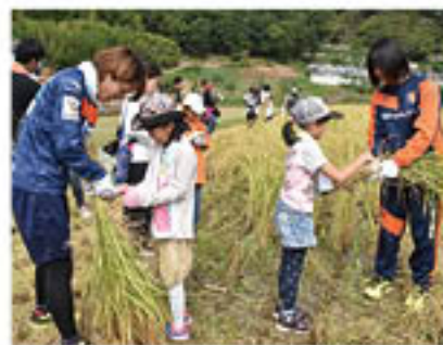
レディースチーム選手と稲刈り体験