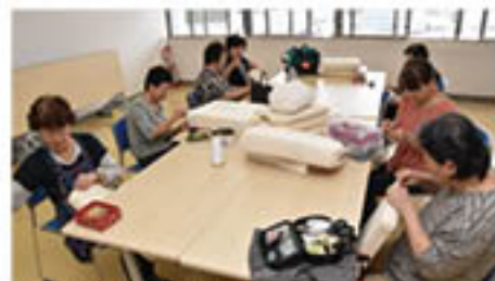
黙々と作業をすすめる

女性部松代総支部7人は、寺尾支所で9月22日、長野松代総合病院に向けたボランティア活動を行いました。クッションの端を縫い合わせて床ずれ防止用のクッションをつくる作業と、ゴミ捨てにつかう新聞紙を一枚一枚折りたたむ作業をしました。