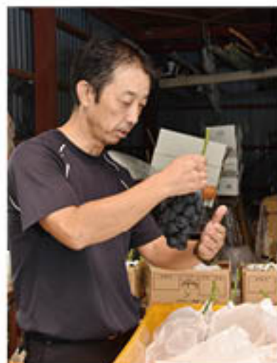
仕上がった房を確認