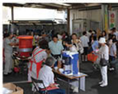
多くの来場者が訪れた会場

グリーン大阪では、地区の役員、組織の会員が中心となり、各地区で、様々な支店協同活動を展開しています。