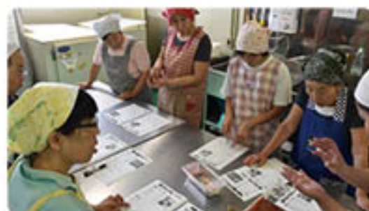
調理の流れを確認します