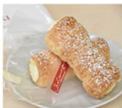
1個200円(税込)で販売した「りんこる」

発売の前に、同チームのフェイスブック等で事前告知。発売日には、限定200個が即完売するなど大好評でした。今後もパルセイロのホームゲームやJ Aのイベントで限定販売する予定です。