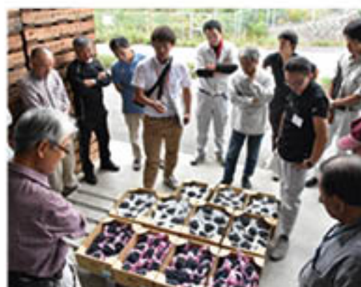
出荷物を見て、意見交換

ぶどう部会では9月中、出荷最盛期を前に支部ごと「講習会」を開き、品質向上をめざした荷づくりのポイントや注意点を確認しました。