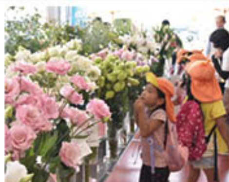
「お花の名前を覚えたい」と見学する園児

花き部会は、篠ノ井のA・コープファーマーズ南長野店で9月15日、「第24回JAグリーン長野フラワーショー」を開きました。部会員45人から129作品の花き品目が出展され、会場は彩豊かに、華やかでした。