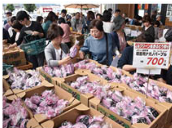
大混雑する会場(A・コープファーマーズ南長野店)

品種の味を確かめ食べ比べができる試食コーナーでは、部会員が品種の特徴や今年の仕上がりを説明し、PRにつなげていきました。