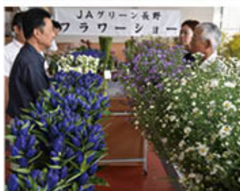
審査をすすめる審査員