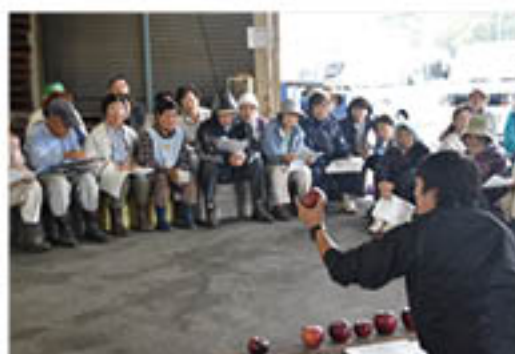
外観・手触りから収穫適期を判断するよう説明

「シナノドルチェ」「紅玉」出荷 JAでは、りんご中生種の「シナノドルチェ」「紅玉」の出荷が9月15日から始まりました。 このうち、「シナノドルチェ」は、標高の高い信更・若穂地域で生産量が増えています。収穫講習会は、信更町の信更流通センターほか3会場で9月12日に開催。営農技術員が、収穫期の判断や、生産者による一次選果のポイントを中心に説明し、「1個でも多く、1円でも高い販売をめざすことを確認しました。」