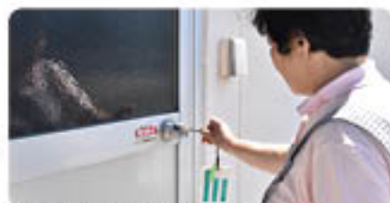
鍵を開けて中に入ります