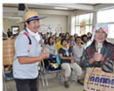
麦畑を熱唱する川畑部長と堂園副部長

グリーン鹿児島島の助け合い組織みどりの会西谷山支部は9月16日、敬老の集いを行い、地域の高齢者と歌や踊りを楽しみました。