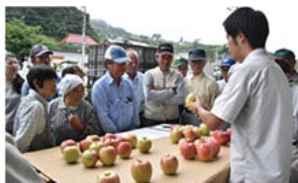
見本を見て一次選果の基準を確認

「シナノドルチェ」「紅玉」出荷 JAでは、りんご中生種の「シナノドルチェ」「紅玉」の出荷が9月15日から始まりました。 このうち、「シナノドルチェ」は、標高の高い信更・若穂地域で生産量が増えています。収穫講習会は、信更町の信更流通センターほか3会場で9月12日に開催。営農技術員が、収穫期の判断や、生産者による一次選果のポイントを中心に説明し、「1個でも多く、1円でも高い販売をめざすことを確認しました。」