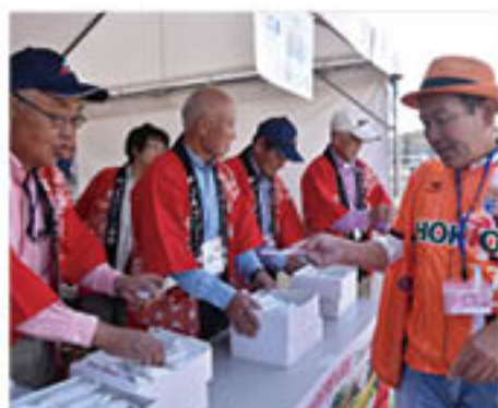
「りんこる」をJA理事が300人に配布