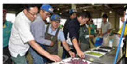
「甘い」「うまい」と試食に手をのばす