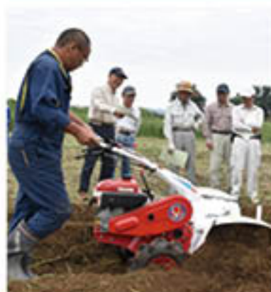
管理機の安全使用を学ぶ

定年帰農者らを対象に開く「グリーン農業講座」を9月2日に開き、農業機械の使用法を指導しました。