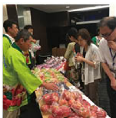
グリーン長野産果実をPR

JAは、(株)ANA総合研究所と連携し、都内同社内で9月26日、「ANAマルシェ」を開きました。