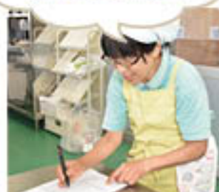
計算しながら記入します

掃除等を終わったら、「利用明細書」に詳細を記入しましょう。また、ガスの元栓を閉めたか、トイレの電気を消したかなど、戸締り前の最終確認をしましょう。