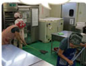
みんなで協力して片付けます

調理器具はしっかり洗い、所定の位置に戻しましょう。また、調理台はきれいに拭き、流し場のごみを片付けましょう。床も掃き、モップで拭いて隅々までキレイにしましょう。