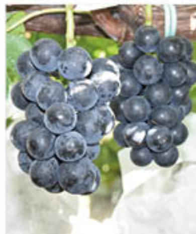
収穫をむかえた「ブラックビート」