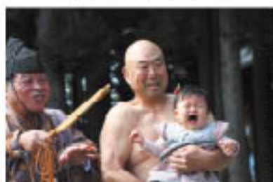
表 賞 佳作