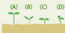
半分程度を目安に