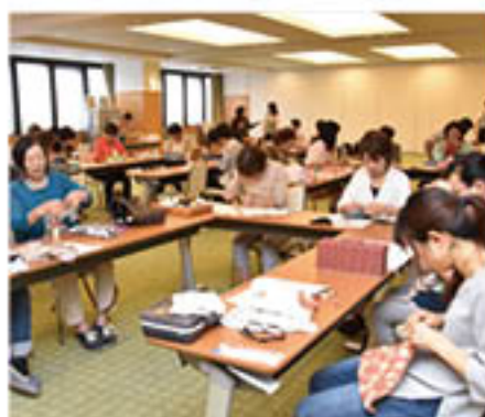
作業をすすめるカレッジ生

JAは、組合員・地域の女性のみなさまを対象に、第3期目となる「JA女性カレッジ」を9月20日に開校しました。これは、JAをよりどころにして、「女性ならではの」趣味や楽しみを増やすとともに、仲間づくりを目的とした講座。新規カレッジ生18人を含む総勢100人が、JA推薦図書「家の光」を教科書に、料理や手芸、美容に関するさまざまな活動に1年通じて取り組みます。