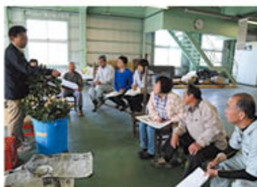
つぼみの固さを確認する生産者

花き部会シャクヤク専門部は、シャクヤクの最盛期にあわせて5月8日、2会場で講習会を開催しました。篠ノ井の東部青果物流通センター会場には10人が参加。営農技術員が実物を示し、「つぼみの固さ」を目安に収穫し、「切り遅れ」に注意することを申し合わせました。生産者は、「草丈が長くつぼみの大きいポリariumある」ものを出荷したい」と意気込みました。