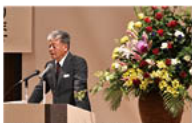
JAへの意思結集を求める神農組合長

総代会の冒頭で、神農組合長があいさつ。「組合員のみなさんにご協力いただき、県下でも誇れる事業成果をお示しすることができた」と感謝を述べたうえで、30年度は中期三カ年計画の最終年度として、また、新たな計画の樹立に向けて、改めて計画の達成に向けた精進な運営を約束。さらに、合併や統廃合はせず、組合員・地域の負託に応えていくことを表明し、「農業・農家を守り、組合員のための組織であり続けるための正しい運営に向けて、みなさまと一緒に頑張って成果を勝ち取ってまいりたい」と、協力を求めました。