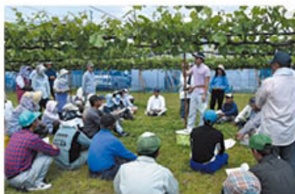
ぶどうの管理講習会(5月22日・篠ノ井東)