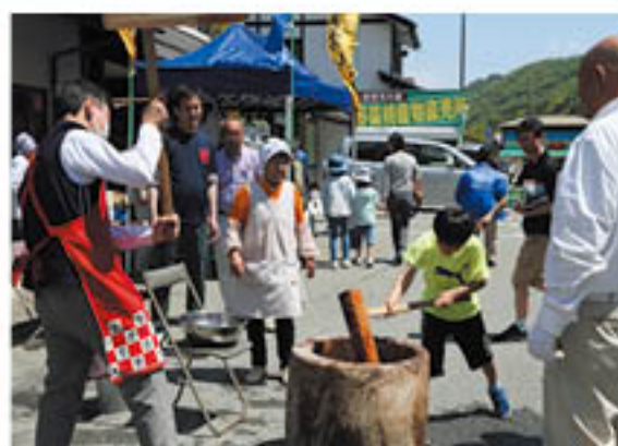
飛び入り参加で活躍する子ども