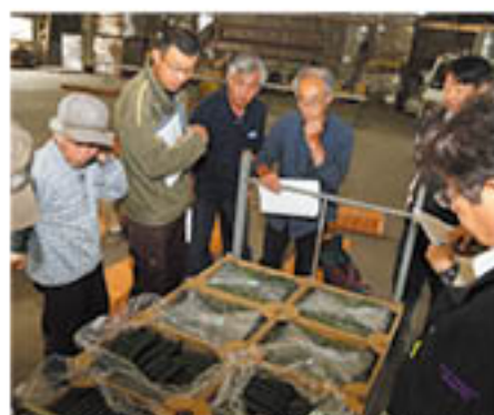
見栄えを意識した箱詰めを確認する生産者