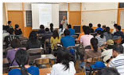
食育教室で生産者の想いを話す青壮年部員 (5月27日、篠ノ井にて)

青壮年部とJAは、食農教育活動とスポーツの融合イベント「かいぶつのだねフェスティバル2018」で、青壮年部員が栽培した野菜を子どもたちにふるまい、農産物の消費拡大PRや次世代との交流につなげました。