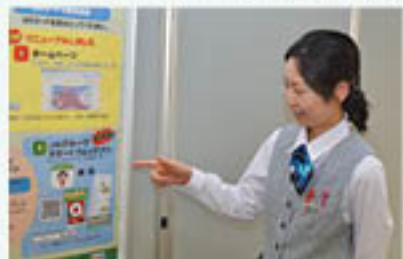
「JA旬みっけ!」ダウンロード獲得をPR

グリーン大阪では、JAグループ・無料アプリ「JA旬みっけ!」のダウンロード獲得に向けた特別運動を実施しています。