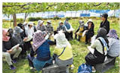
摘房について学ぶ参加者 (5月22日、若穂にて)

女性部若穂緑支部ぶどうクラブは、栽培管理講習会を開き、20人が参加しました。女性だけの講習会は、「男性に遠慮せずに技術員や仲間に質問しやすい」と和気あいあい。活発に情報を交換・共有していました。