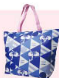
▲保冷トートバッグ

※ご融資金利はJA所定の基準金利(パーソナルプライムレート)を基準とし、年2回見直しを行います。