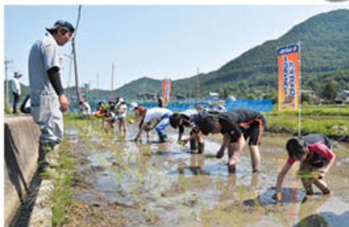
青壮年部員の指導で田植えをすすめる参加者

5月27日には、松代町東条にある青壮年部員の水田で「田植え」を開催。応募者9組25人の親子が、青壮年部員5人のサポートのもと、パルセイロトップチームの元選手やレディースチームの現役選手と一緒に、楽しみながら手植えをし、農業のやりがいを感じるとともに、交流を深めていました。