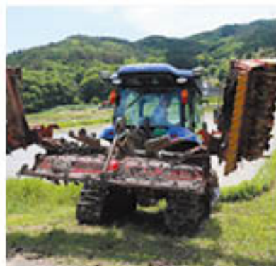
代掻き後、機械の点検