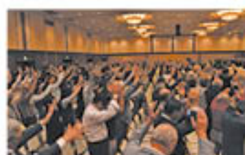
万歳三唱で意思結集する会場

最後に、「国際貿易交渉対策とJA自己改革完遂に関する特別決議」を採択し、拍手をもって承認するとともに、会場全員で万歳三唱。改めて「JAと組合員一丸となった農業振興」へ想いを一つに、大きな拍手が沸き起こるなかで閉会しました。