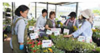
組み合わせ方について説明を受ける参加者 (5月16日、篠ノ井にて)

JA女性カレッジは、「運氣アップ!夏に咲かせたい寄せ植え講座」を開き、39人が参加しました。生花店講師は、「好きな花を選ぶことが、何よりの気分アップ」と話し、花色や草丈など花の特徴を活かした組み合わせ方を伝授。参加者は、オリジナルの鉢を完成させました。