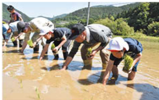
児童と真剣に田植えに取り組む青壮年部員

青壮年部松代支部は、松代町豊栄の水田で5月25日、長野市立豊栄小学校5学年の児童へ「田植え」を指導しました。同校の依頼を受け、「食農教育」の一環として、田植え・収穫のほか、田起こしや代掻き、水管理や草刈りも児童と共に行い、農業の楽しさや苦勞を分かち合います。