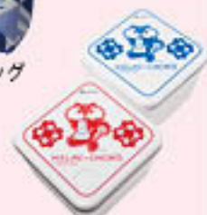
▲フードコンテナ セット

お問い合わせ 篠ノ井ローンセンター tel.0120-915-848 または 各支所