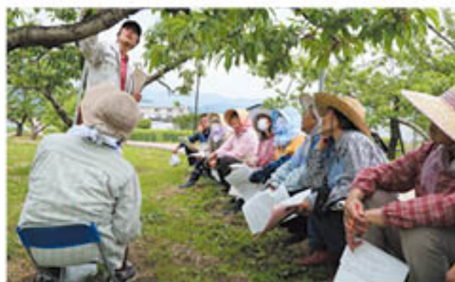
ももの摘果講習会(5月17日・川中島)

今年は、3月からの温暖な気候により、各農作物の生育と栽培管理作業が昨年に比べて早くすすんでいます。JAでは、作業遅れに注意し、段取りをつけて適期作業を行うことで、収穫量や品質を高めようと、各生産部会を対象に、作物・地区ごとに講習会を開催。営農技術員が現状の生育状況にあわせた指導を行いました。