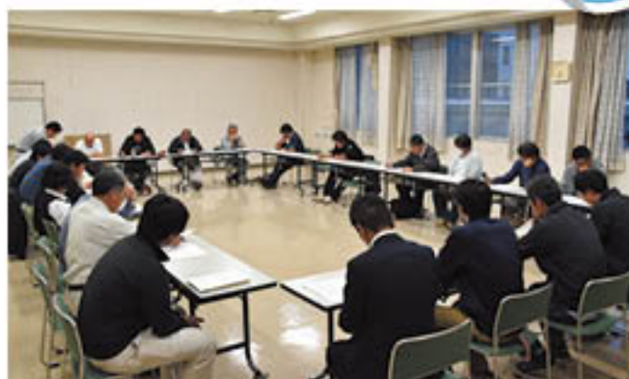
会議をすすめる青壮年部役員ら

協議では、生産販売部が計画する消費宣伝会や食農教育活動の「パルセイロ農園」「かいぶつのだねフェスティバル」等の日程や内容を確認。自身らが栽培した農産物を含め、JAの農産物のPRと販売拡大をめざして、積極的に青壮年部活動への参加者を増やす方針を確認しました。