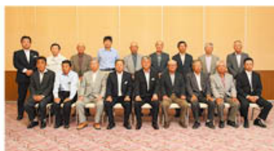
宮農相談員に任命された生産者とJA役職員

会議には関係者20人が出席し、総勢15人の相談員とJ Aが連携し、積極的に指導や支援を行うことを確認しました。