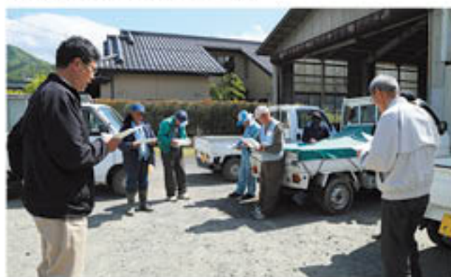
タマネギ管理講習会(5月10日・松代)