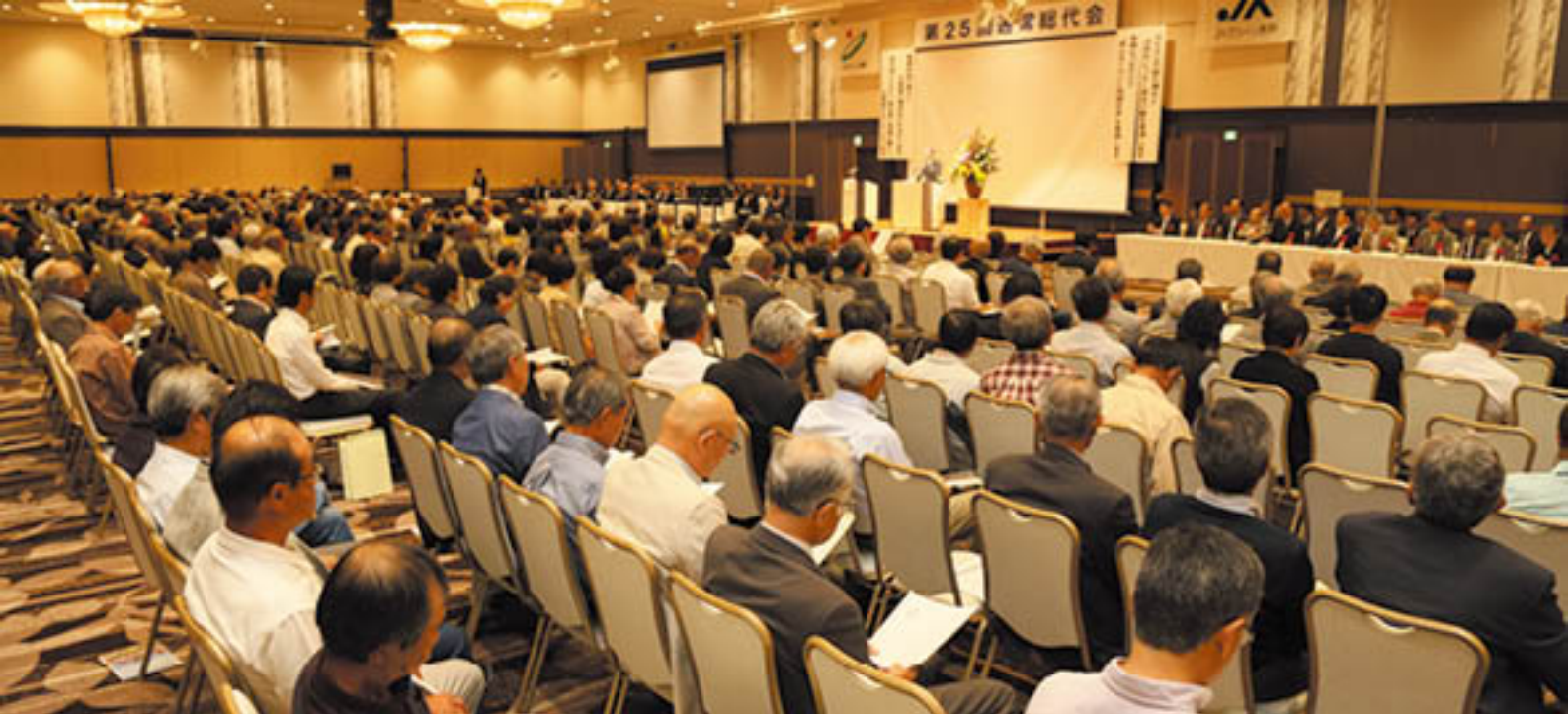
総代670人(本人出席314人、委任状出席3人、書面出席353人)に出席いただいた総代会

質疑応答後、出席者の挙手によって採決。議長が、出席総代過半数の挙手と書面議決書の賛成数を確認し、議案の承認を宣言しました。これにより、20年度は事業総利益37億円余を計上し、当期剰余金は2億8千万円余、経営の健全性を示す単体自己資本比率は16.82%の黒字決算となりました。