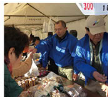
多くの来場者に多忙を極める生産者

J Aが運営する道の駅大岡特産センターは2月2日・3日、静岡県沼津市大岡の沼津大岡文化祭内、「信州大岡物産展」に参加しました。「大岡」という共通の地名が縁で長年続ける交流活動の一環。センターに出荷する直売会生産者をはじめ、住民自治協議会、行政が現地を訪れ、りんごや長芋、きのこなどのJ A農産物や、「おやき」などを販売しました。会場には、「毎年販売を楽しみにしている」というリピーター客も数多く来場し、売り切れが続出。「おいしい農産物を届けてくれてうれしい」など、喜びの声が寄せられました。