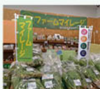
表彰を受けた農産物直売所「フレッシュ・クラブ」

農産物直売所「フレッシュ・クラブ」が1月22日、平成30年度大阪府農業生産・経営高度化優秀農業者等選賞事業に係る大阪府知事表彰を受けました。また、3月9日には、JA全中、JA都道府県中央会、NHKが主催する第48回日本農業賞「食の架け橋の部」の優秀賞を受賞することが決定しました。