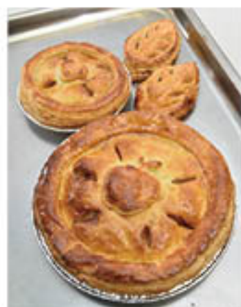
香ばしく焼きあがるパイ