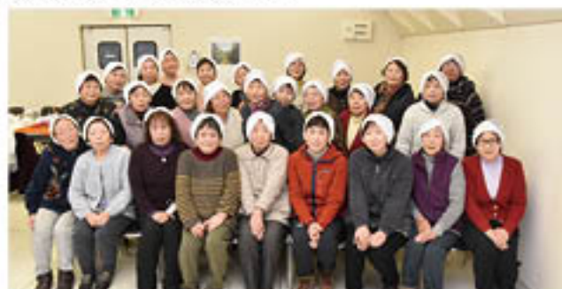
「似合うかしら?」と被って写真撮影

女性部若穂総支部は2月1日、若穂ふれあいセンター(若穂支所向かい)で、冬期講座を開きました。26人が参加し、地元の女性を講師に招いて、講師が考案した「頭巾」をつくりました。講師が用意したオリジナル型紙にあわせてハギレを切ったあと、参加者同士で教え合いながら縫い合わせる作業を個々に進行。参加者からは「裁縫が苦手だけど、上手にできた」「みんなでやれば教えてもらえるので、楽しい」と、総支部活動の「意義」を感じさせる声が寄せられていました。