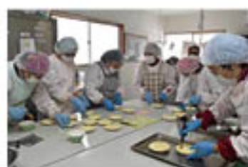
作業をすすめる女性たち