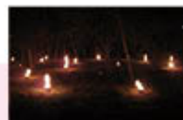
▲ローソクかすを燃やす様子

燃焼時間:5時間程度 設置方法:10アールあたり40～60缶 溶かしてから使用する