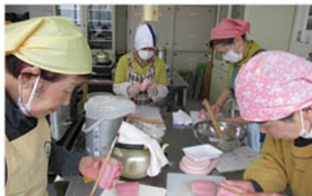
赤カブを着色料にしたピンクのやしょうまづくりに挑戦

JA女性カレッジは2月20日、若穂公民館で「やしょうまづくり」に挑戦しました。午前・午後に分かれて総勢24人が参加。2人一組になって色と形が違う2種類のカラフルな「やしょうま」をつくりました。参加者の多くが1度はつくったことがあるなか、こね方や伸ばし方に苦戦をする人が続出。講師の指導を熱心に聞き、「改めて基本を学ぶことができた」と手ごたえをつかんでいました。