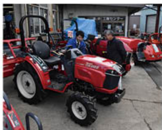
乗用トラクターの性能を説明するJA職員

会場には大型機械、管理機などの小型機械、また、中古農機も含めて約80台を展示。早朝から来場客が訪れるなか、職員が機械の性能等を案内しました。会場内を見学した男性客は、「地元で開いてくれると来やすい。最新の機械がほしくなった」と今後の開催に期待を寄せていました。