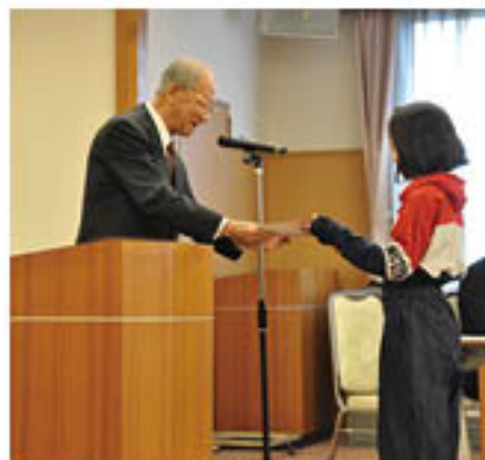
小演劇団から修了証を受け取る塾生

J Aと更級農業高校が連携して1年間に渡り開いてきた「親子ふれあい農業塾」の「閉校式」を2月16日、篠ノ井のグリーンパレスで開きました。親子17組と高校生が出席。塾の前身「X Y サタデースクール」から協力する特別顧問小演劇団さんから修了証を受け取りました。参加者は体験談を発表。「草取りが大変だったけれど、収穫できたときはとても嬉しかった」「野菜が好きになった」と感想を寄せました。最後には、今後も「地産地消」や農作業体験を通じ、「地域の農業を応援していく」とを参加者全員で確認しました。