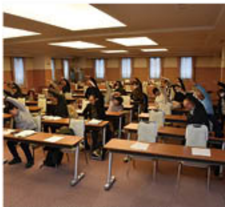
ストレッチ体操に挑戦する受講生

講話後には閉講式を開催。営農技術員は、「講座を機に農業に挑戦し、J Aへの出荷につなげてもらいたい」と呼びかけ、技術指導や販売対策など、今後の支援継続を約束しました。