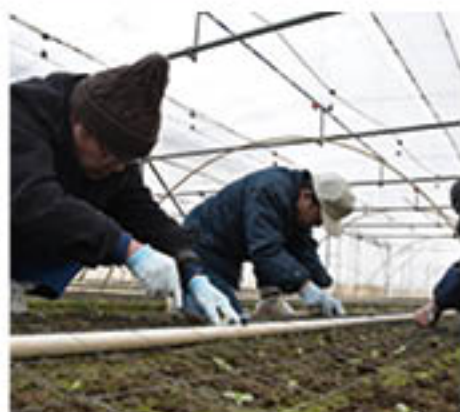
「根を切らないように」と注意し定植を体験

J Aは、「トルコギキョウ」の生産振興に向け、新規栽培希望者向けの「トルコギキョウ栽培セミナー」を2月4日、長野農業改良普及センターと連携し、初開催しました。昨年10月に開いたトルコギキョウ見学会から希望者を募り、5人が参加。出荷まで生育にあわせて全3回企画しています。