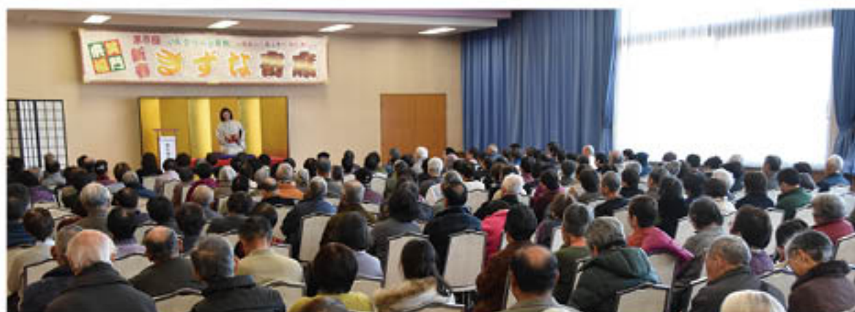
話芸を披露する出演者