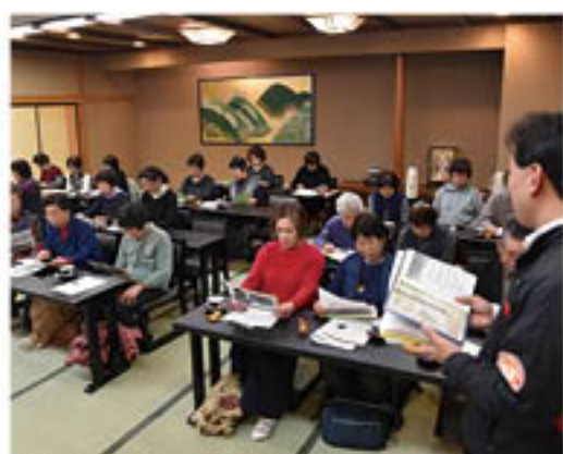
31年度の花き生産方針を確認

会場では、花き生産方針を確認した後、メインイベントの一つ「落語」を堪能。参加者は「とても楽しく過ごせた」と話し、「また農業を頑張りたい」と意欲をみせました。