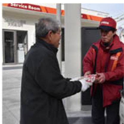
オープン記念品を渡す職員

オープン当日は、利用客に記念品を進呈。ガソリンの給油に訪れた男性客は、「とてもキレイになり驚いた。区内で給油ができることは本当にありがたい。これからも利用させてもらう」と話しました。