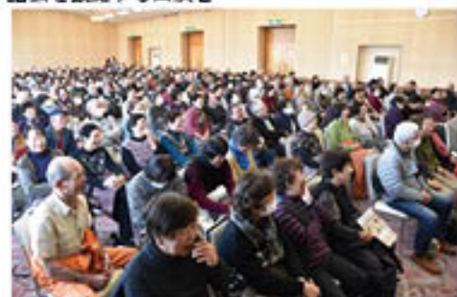
満員の会場に“笑い”の熱気

年金友の会連絡協議会と女性部は、稲里町のグリーンホールミナミで2月18日、「新春きずな寄席」を開きました。末広がりの8回目となる今回は、過去最高となる281人が来場。「初笑い」で春よ来い「福も来い」をテーマに、5人の社会人落語家が古典落語の「元大」「半分瓶」「宿屋の富」「粗忽の釘」「紙入れ」を披露し、会場には「笑い」や拍手で熱気に満ちあふれていました。来場者は「たくさん笑った。元気で一年頑張ることができそう」と話しました。