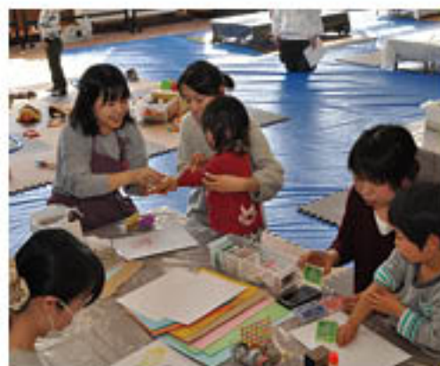
それぞれ「世界に1つ」のオリジナル作品づくり

1歳以下の子を持つ保護者を対象にした「J A共済アンパンマン子どもくらぶ」は、稲里町のグリーンホールミナミで2月2日、冬のイベントを開きました。会員親子15組が参加。8月にも行い、大好評だった「手形アート」に挑戦しました。手形アートとは、子の手形を紙に写し、そこに模様を書き込み、動物や季節のモチーフに見立て成長記録に仕上げるもの。会員独自の工夫やメッセージを加え、オリジナル作品を完成させました。作業後は完成品を手に、会員間の交流も深めていきました。