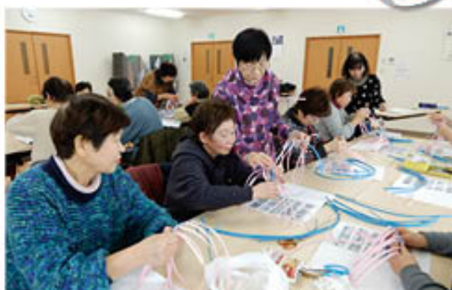
講師に教わりクラフトバンドを編む参加者

女性部篠ノ井総支部の仲間を講師に迎え、参加者は改めて基本・応用の編み方を教わり、個々に作業を進行。根気のいる作業に励まし合い、参加者同士の会話も楽しみながら、無事に全員が作品を完成させました。参加者からは「またつくってみたい」と要望があがりました。