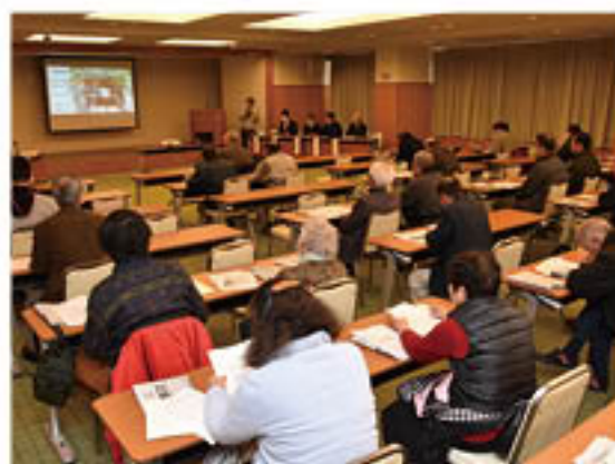
課題克服に向けて研修

拠点づくり、健康づくりや介護予防等の「くらしをつくる」ための取り組み、組合員と一丸となったJAのPR等の「JA・共感をつくる」ための取り組みに注力したことを各支所長らが説明しました。あわせて、31年度からの3カ年間は、農業振興をはじめ、JAの成長・効率化戦略を盛り込んだ支所・事業所構想の具体化に取り組む考えを説明。出席者に意見を求めるとともに、意見に基づいてJA全体で再検討し、事業に反映させることを約束しました。