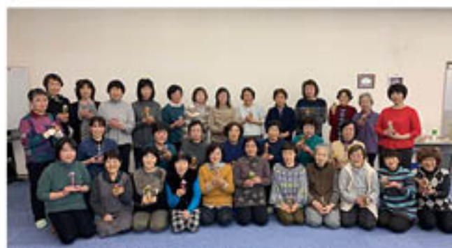
「部屋に飾るのが楽しみ」と笑顔の参加者

女性部川中島町総支部は川中島ふれあいセンター(中津支所敷地内)で2月5日、31人が参加し、「ハーバリウムづくり」に挑戦しました。ハーバリウムは、ドライフラワーやプリザーブドフラワーを透明な瓶に入れ、専用のオイルで浸し密封したもの。部屋を彩るインテリアとして好評です。ハーバリウムづくりは初めてという参加者も多く、地元講師に作業方法を教わったのち、好みのドライフラワーを組み合わせて、作品づくり。「どの花を組み合わせよう」「どっちの色がいいかな」など、参加者間でアドバイスをし合いながら、オリジナル作品を完成させました。