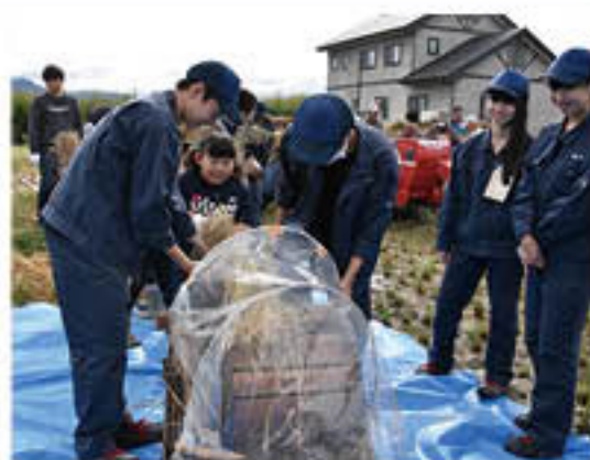
足踏式脱穀機に挑戦

J Aと更級農業高校が開く「親子ふれあい農業塾」は川中島町の水田で、10月5日に「稲刈り」を、26日に「脱穀」作業を行いました。各日とも高校生と受講生親子、水田の管理に携わるNPO法人「風とみどりの会」が参加し、協力して作業を行いました。