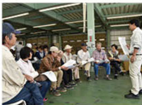
出荷規格について意見を交換

花き部会トルコギキョウ専門部では10月上旬、「トルコギキョウ」の出荷が本格化しました。9日に藤ノ井東部青果物流通センターで目揃い会を開催。生産者9人が参加し、規格に沿った選別を確認。また、市場の先の「現場」が扱いやすいように「ひと手間」をかけて枝や葉を整理し、「より品質の高い花の出荷」を申し合わせました。専門部では、各生産者が出荷時期をずらしリレーすることで、11月下旬まで長期間の出荷をめざしています。