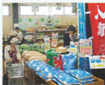
人気の新米販売コーナー

グリーン近江農産物直売所「きてか～な」は9月3日から、滋賀県独自品種「みずかがみ」の新米初売りを始め、県内外から多くの来店客で賑わいました。特設コーナーには「新米入荷」ののぼりを掲げ、1升樹に白米を盛り上げて稲穂を飾り付けました。