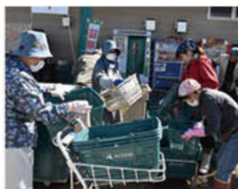
買い物カゴの洗浄に協力する直売会員

A・コープ直売会は16日、A・コープ松代店の復旧作業支援を行いました。直売会員の「自分たちもぜひ協力したい」という申し出から、15日夜に会員に直売会のメールで協力呼びかけました。当日は午前・午後に分かれて延べ80人が参加。店舗従業員とともに、店舗内外で清掃作業に取り組みました。生産者は、「いつもお世話になっているので何とかしたい」、「自分がつくった農産物の売り先が無くなってしまふので、ぜひ早く営業にこぎつけて貰えば嬉しい」など、それぞれに早期復旧への想いを口にし、作業に精を出していました。