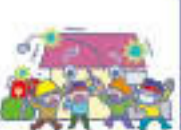
騒じょうなどに伴う暴力行為または暴行