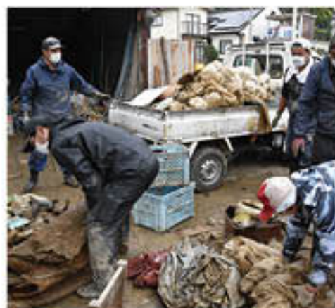
被災した資材等を運び出す青壮年部員

初回の支援は、20日・21日の2日間に、延べ44人の部員が参加して作業。被災した部員4人のほ場で、資材の片付け等を行いました。支援を受けた部員は「施設が水没し、精神的にも労力的も増えたが、多くの仲間のおかげで、本当に感謝している。まだ厳しい状況にあるが、新たなスタートを切りたい」と話しました。