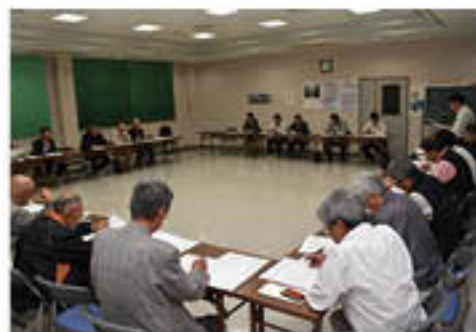
地区の対策方針について意見を交わす

更北地区では、生産者や地元自治体の要望のもと、JAを主体に「更北地区農業災害対策委員会」を18日に設立しました。河川敷を中心に、地区農業の再生に向けて、各処が互いに情報共有を密にし、協力しながら、復旧に向けた対策や作業を順次進めていくことを確認しました。