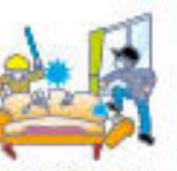
暴行などに伴う暴力行為または強行行為