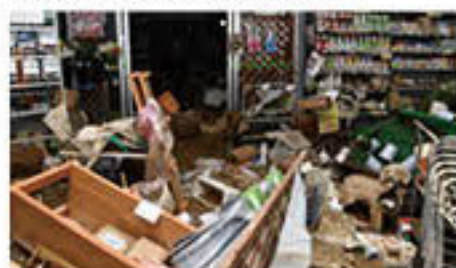
水が流れ込み、店舗内の品物が散乱 (JAファーム松代店)