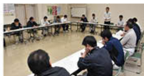
営農担当部署による農業被害対策会議を開催