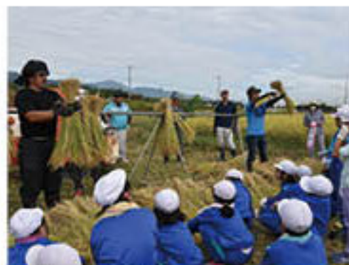
はぜ掛けのコツを説明

塩崎支部は11日、篠ノ井の塩崎小学校の児童へ稲刈りから脱穀までの一連の作業を指導しました。部員6人と塩崎支所職員が参加。6月に児童が植えた稲を、手刈りするとともに、はぜ掛けと機械を使った脱穀にも挑戦しました。はぜ掛けでは、稲束をはぜ掛け棒により多く掛ける知恵を伝授。児童は、青壮年部員の説明に沿って、一人ひとり、自分たちで束ねた稲束を掛けていきました。