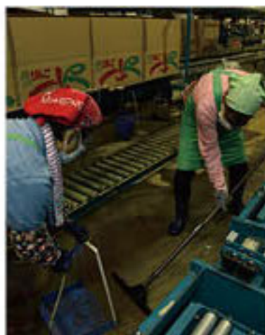
選果機周辺の清掃をすすめる篠ノ井西部青果物流通センター従業員

各施設では、水が引き始めた13日・14日からJ A職員が状況確認を行い、職員をはじめ、J Aグループ、取引業者らの支援も受けて、水や泥のかき出し、ゴミの撤去作業等、復旧に向けて作業をすすめています。