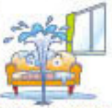
給排水設備に生じた事故による水ぬれ