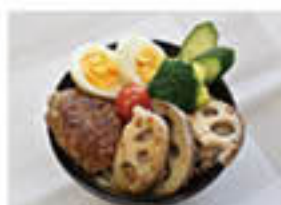
ボリューム満点「もちもちレンコンバーグ丼」