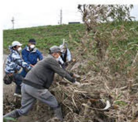
ももの木に絡んだゴミを取り払う

河川敷道路の陥没や土の堆積等もあり早期の復旧が困難な園も多いなか、支部では決して農業を諦めることなく、もも部会や地区にその活動を派生させ、皆で協力し産地の復旧・復興をめざしています。