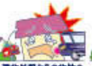
建物外部からの物体の衝突または建物内部での車両の衝突 ※自然災害によるものを除きます。 ※建物内部での車両の衝突は、平成29年4月1日以降のご契約の場合に保障します。