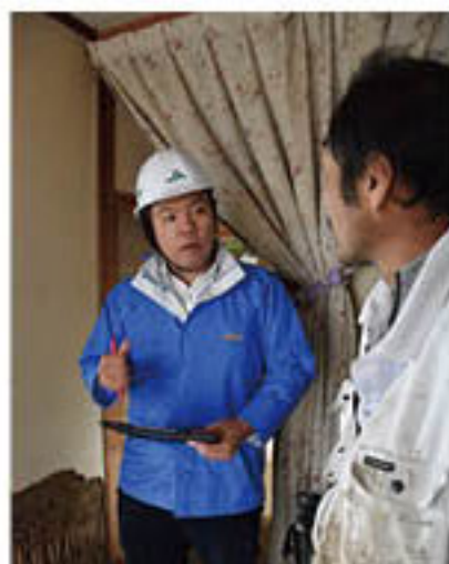
被災者宅でJAの支援を説明する職員

J A共済部・各支所では被災地区を中心に、13日から電話での相談対応や、現地確認を始めました。また、J A共済連長野と連携し、共済のご契約をいただいている組合員・利用者の被災状況調査を、16日から本格的に開始。ライフアドバイザーやJ A共済連長野の損害査定員が、浸水被害が発生した篠ノ井や松代地区を中心に、個別に連絡を受けた契約者の自宅を訪れ、契約者にお見舞いを伝えるとともに、浸水の深さを測定し、損害状況を把握しました。あわせて、契約内容を確認し、一日も早い共済金のお支払いにつなげるよう、手続きを進めていくことを伝えました。現場調査を行った職員は、「現場を目の当たりにし、お客様の無事を確認し、被害の状況をお聞きし、自分も泣きそうになった。少しでも早くご契約いただいた共済でお役に立ちたい」と話しました。