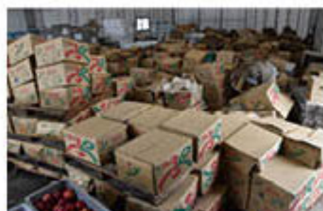
出荷物や資材等が水に浸かる (篠ノ井西部青果物流通センター)