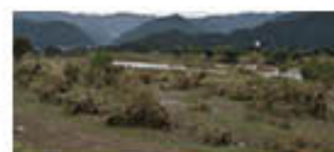
水がひいた河川敷