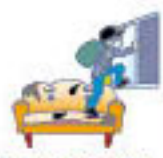
盗難による盗取、損傷または汚損