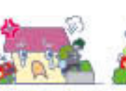
盗難による盗取、損傷または汚損