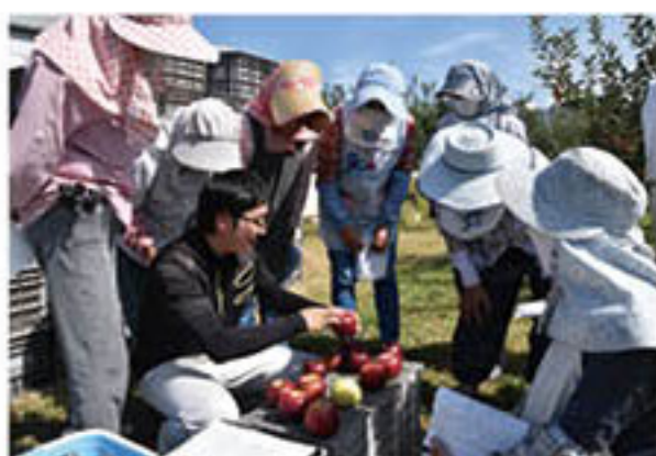
「秋映」の講習会で選果基準を確認(真島会場)

りんご部会では10月中、長野県生まれのりんご「秋映」「シナノスイート」「シナノゴールド」の出荷が始まり、品種リレーをしながらJAりんごの売場を確保・拡大し、販売を強化しています。台風15号による風落やキズ、台風19号の水害等の影響も受け、当初よりも出荷量の計画を下方修正していますが、生産者による一次選果や収穫期の徹底により、品質と出荷量の維持、生産者手取りの確保につなげています。