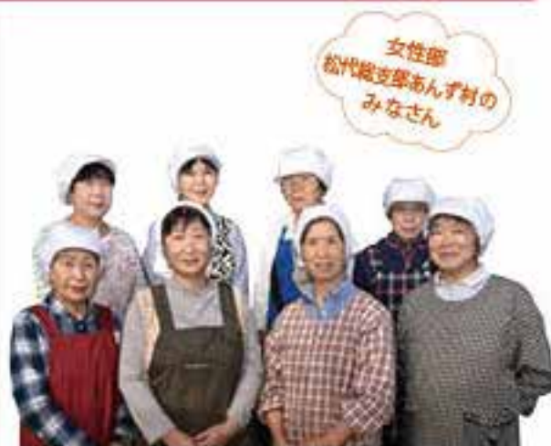
女性部 松代総支部あんず村の みなさん