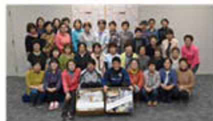
「共に頑張らしましょう」と寄贈

同チームでは練習場などが台風19号で被災。カレッジ受講生は見学を縁にチームを支援しようと、チームの要望のもと、復旧作業に使う「軍手」231双を持ち寄り、贈りました。