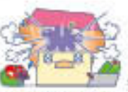
破損または爆発 ※地震などによるものを除きます。