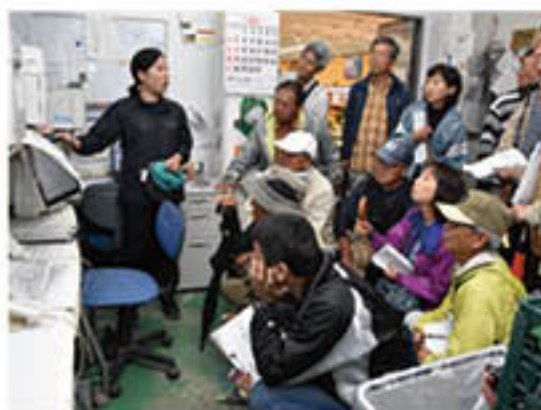
出荷バーコードを作成する方法について説明

定年帰農者らを対象にした「グリーン農業講座」を10月12日、篠ノ井のA・コープファーマーズ南長野店直売所で開き、受講生19人が参加しました。農作物を「作る」ことに加えて「作ったものを出荷販売すること」に挑戦し、やりがいや楽しみを感じ、栽培意欲の向上、経営規模の拡大につなげてもらおうと企画。直売担当がA・コープ直売会や直売所の概要を説明しました。受講生は、直売会の手続きや出荷法など熱心に質問を寄せていました。