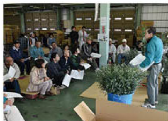
需要が高まる品種について説明するセンター長

花き部会花木専門部は10月28日、藤ノ井東部青果物流通センターで「ユウカリ」の講習会を開きました。2回に分かれて新規出荷者6戸を含む全専門部員60戸が参加。営農技術員が台風19号被害への対策をはじめ、販売情勢や出荷上の注意点を説明しました。ユウカリは、市場からの需要が高く、生産面では、低コストで作業負担が少なく導入しやすい品目として、花き部会をあげて生産振興をはかっています。