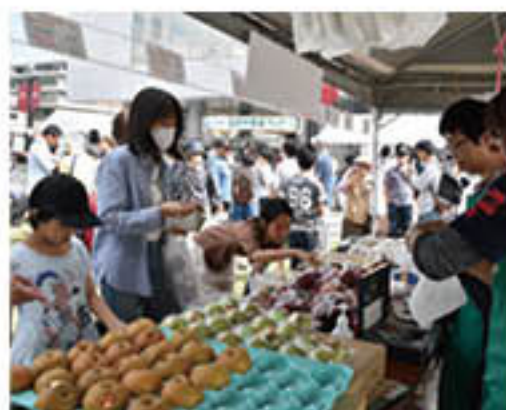
次々に農産物が売れていくJAブース

J Aは10月5日、長野市役所第一庁舎西側広場「桜スクエア」で開かれた「2019長野市農業フェア」に出店しました。旬の果実をはじめ、野菜、きのこを販売。地元客らに「地産地消」を呼びかけ、農産物を通じ、長野市の農業をPRしました。全ブースが参加するタイムセールでは、ふどう「シャインマスカット」「クインニーナ」のセットを特別価格で販売。来場客が長蛇の列を作り、開始5分で完売するなど大盛況を博し、PRと消費拡大に手応えをつかみました。