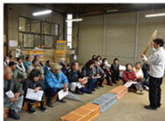
芋の形状による選別基準を説明