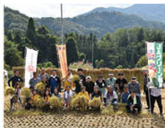
稲刈作業に汗を流した各団体メンバー

J Aは、長野市、東京都銀座のNPO法人「銀座ミツバチプロジェクト」、篠ノ井の酒造店と連携し、大岡で酒米をつくり、その酒米で清酒「積善GINZA」づくりを進めています。大岡地区をはじめ長野市の魅力のPRによる地域の活性化や、各団体との連携強化を目的とした、今年で4年目の取り組みです。