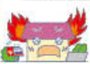
火災 ※地震などによるものを除きます。