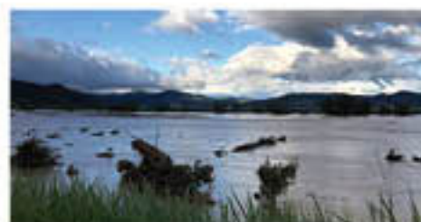
14日早朝の千曲川(松代町付近)

組合員の暮らしへの被害は、篠ノ井・松代を中心として真島・若穂地区において、住宅の床上・床下浸水、自動車の水没等が発生。JAでは、農業・暮らしの両面で状況確認をすすめ、行政と連携しながら、一日も早い復旧に向けて全力でみなさまを支援します。