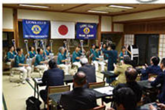
指揮に合わせてスコップを奏でる

グリーングリーンでは、引き続き、地域からの演奏依頼も受けながら、スコップ三味線や演奏を通じた女性部のPRにつなげていく考えです。