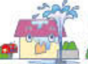
給排水設備に生じた事故による水ぬれ ※自然災害によるものを除きます。