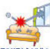
建物外部からの物体の衝突または建物内部での車両の衝突