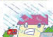
暴風雨・洪水 ※床上浸水も保証します。