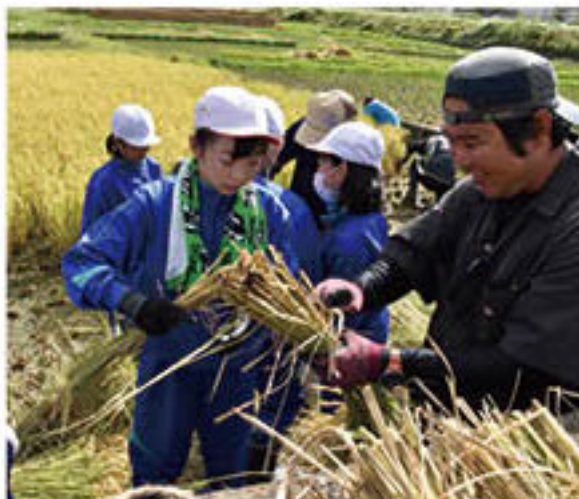
稲を束ねる作業を手伝う青壮年部員

会場は、部員の指導のもとで5月に児童が力を合わせて田植えをし、部員や教員が水管理を行って大切に育ててきた水田。青壮年部員が、鎌の持ち方や扱い方の注意点、稲を束ねて麻ひもで縛るように説明し、気合を入れて作業に取り掛かりました。部員は、刈り取りをすすめる児童に「鎌の扱い方がうまいね」「頑張ってる」と声を掛け、児童が苦戦していた稲を束ねる作業をサポートしました。部員は、「田植えの時には、泥遊び等も始まってしまったが、今回はみなさんとても頑張ってくれている。田で遊ぶ経験も大事にしつつ、今日の稲刈りの大変さや楽しさも心に残し、おいしいお米を食べてもらいたい」と話しました。