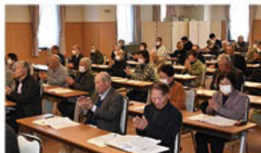
拍手で議案を承認する会場

花き部会は3月17日、55人が参加して総会を開催しました。令和元年度は9千万円の実績を確保した上、生産者の高齢化のなか、部会員数が純増。令和2年度も8専門部活動を主体に、講習会や研修会等を行いながら技術向上・品質統一をはかり、女性対象研修会やフラワーセミナー等を通じて、会員間の情報共有につなげる方針を確認。花きや品目をこえた複合栽培の推進で、さらなる生産拡大をめざします。