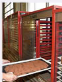
開薬器はJAに設置中