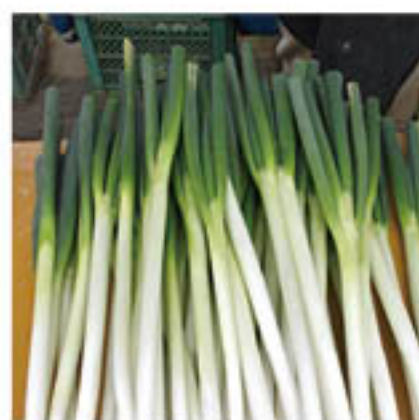
収穫後・荷造り前のネギ(昨年11月撮影)