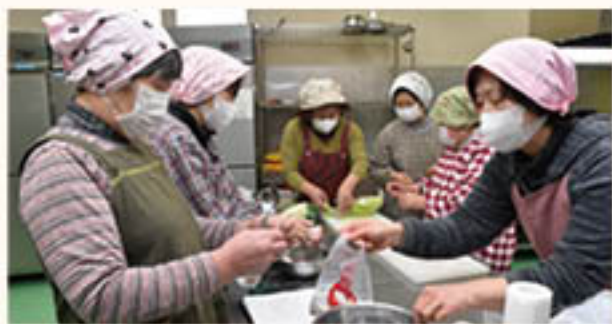
料理のポイントを確認しながら調理(若穂総支部)