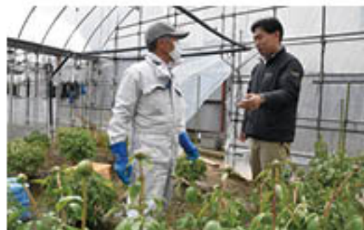
ほ場で個別指導を行う