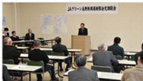
部会名を「特産果樹」に改称決定した新興果樹部会

りんご部会、もも部会、ぶどう部会、新興果樹部会、花き部会は3月中、篠ノ井のグリーンパレス等で「定期総会」を開きました。新型コロナウイルスの感染防止のため、書面議決や役員出席のみと規模を縮小して開催。令和元年度の部会活動を振り返るとともに、令和2年度の活動や生産販売方針を決定しました。また、新役員を選任し、新年度の部会活動のスタートを切りました。