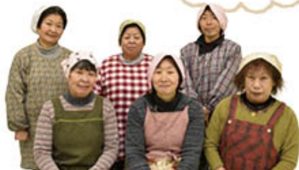
女性部若穂総支部のみなさん