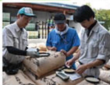
農産(米)の検査も担当

今月号からスタート!あなたのパートナー 総合事業を行うJAのさまざまな“顔”を、ご紹介 します!