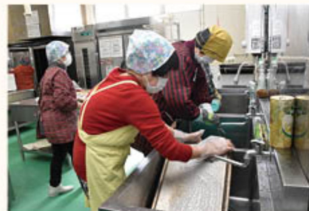
オープン天板を丁寧に洗い、汚れを落とす