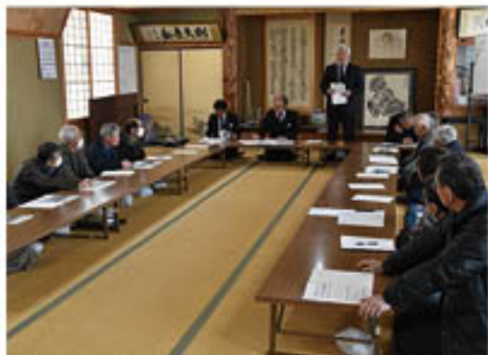
駒村専務が令和元年度実績を含めてあいさつした榑野支所管内会場