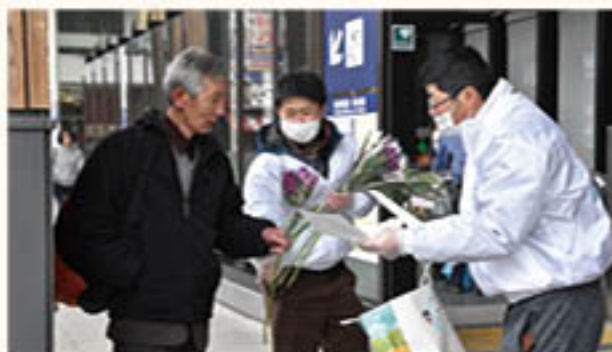
花や牛乳調味品を配布する青壮年部員