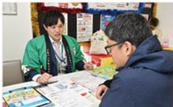
JA住宅ローンのオススメ情報を伝える

サテライトプラザ南長野は3月7日・8日、管内住宅メーカーの「家づくり相談会」とタイアップし、メーカーのモデルハウスを会場に、「住宅ローン相談会」を開きました。見学に訪れた来場客にサテライトプラザ職員が住宅ローン商品について、商品の特徴や金利などを紹介。また、アンケート回答者に農産物セットを贈り、住宅ローンとJAの利用促進をPRしました。