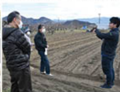
新規栽培者向け講習会を積極開催

野菜・花き・米穀担当の「営農技術員」は、現在9人。担当の農産物の栽培・育成についての指導や販売支援、農業経営の相談・指導、新品種・技術の導入など、生産者の営農支援活動を行っています。特に、野菜・花き・米穀は、それぞれを主力にする生産者はもちろん、果樹などとの複合生産者が多いため、経営の実情に合わせて、品目の組み合わせ提案を通じ、生産量の維持や各生産者の手取り向上をめざしています。