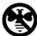
▲訪花昆虫に影響する薬剤を示すマーク

開花中は、訪花昆虫に影響のある殺虫剤や除草剤は使用を控えましょう。影響がある薬剤には、ラベルに右のマークがあるので、確認してください。