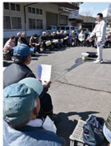
講師の説明を真剣に聞く

講師は、種子全体を薬液に浸けるコツを説明しながら実演。生産者は「改めて注意点を確認できた」と話し、病害の発生防止と優良種子生産へ意欲を見せました。