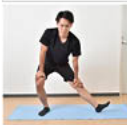
足の裏側全体のストレッチ

脚を肩幅より少し広く開き、腰を落として片足をしっかり伸ばす（つま先を天井に向けるように）。両足3回ずつ行う。