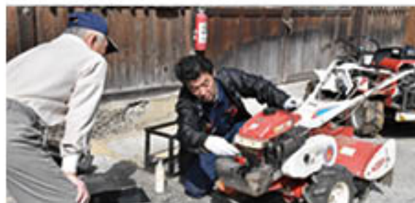
整備しながら生産者と交流するセンター職員

篠ノ井農業機械センターは、3月2日から13日まで「農業機械整備会」を開きました。春の農作業本格化の前に、点検・整備による安全使用につなげるのが目的。台風19号被害により多くの機械が冠水した地区では持ち込み台数が減少しましたが、管理機を中心に、オイルや故障箇所の整備をしました。機械を持ち込んだ生産者は、「整備会は、生産者にとっていい機会。見てもらって、安心して使いながら、災害無く、良いものが収穫できる年になれば良い」と話しました。