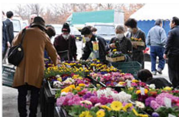
多くの来場客でにぎわう店舗内

開店前のセレモニーであいさつした神農組合長は、「地元や多くの生産者に期待をされ、愛されている店舗であることを改めて感じた。今日を契機にした新たな出発ではなく、被災前からお利用いただいてきた店舗の想いをそのままに、営業していきたい」と話しました。