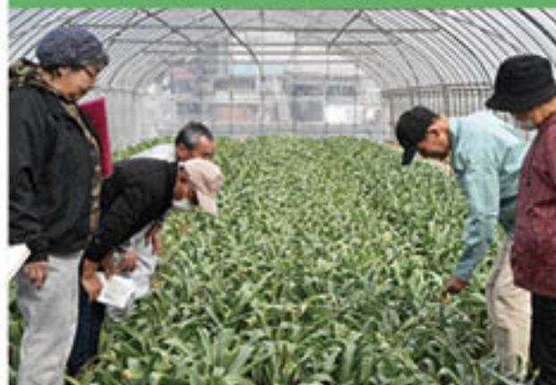
「アリウム」のは場巡回(4月より出荷開始)