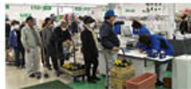
行列ができたレジコーナー