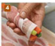
肉を斜めに巻くとよい