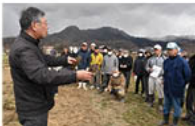
JA全農長野講師が株分けを実演

花き部会菊専門部は3月5日、松代町のほ場で「コギク」の補植管理講習会を開きました。台風19号で冠水被害を受けた生産者28人が参加。コギクは前作の母株から株を分けて増やすため、被災のなかで残った母株の再生と株分けの方法や注意点を学びました。