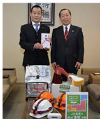
備品を前にして中野組合長(左)と谷口理事長(右)