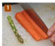
7~8ミリ幅のスティック状に切る