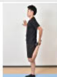
ももの前のストレッチ

壁などに手をつけて立ち、片足の甲を持って膝を曲げる。ももの前側の筋肉を伸ばすイメージで。両足3回ずつ行う。