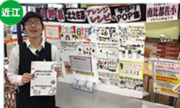
児童が作成したPOPとレシピ