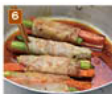
タレを絡ませ味をなじませる