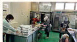
加工室内の掃除の様子

女性部川中島町総支部料理班は3月14日、中津支所併設の川中島ふれあいセンター(加工所施設)の大掃除を行い、施設に感謝を示しました。