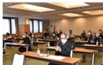
全3号議案を拍手で承認する会場

また、総会にあわせて「花きの病害虫対策」について研修し、品質向上へ意識を高めました。