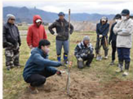
仕立て方について検討する部員とJA職員

参加する部員みんなで意見を交換しながら、技術を高め、地元のもも農家を増やしたい」と話しました。