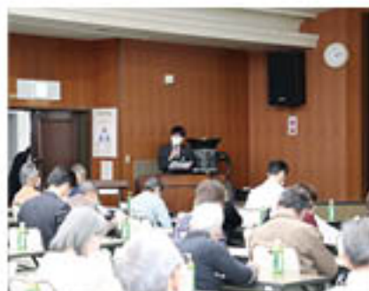
教育文化活動の重要性について講演

分科会では支店・出張所に分かれ、次年度の支店行動計画について支店ふれあい委員の声を反映するために話し合いが行われました。