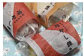
A・コープ直売所で販売する冷やし焼き芋

「私たちの技術力は先輩の生産者さんには到底及ばないんだけど、技術力がない分、これまで得た知識を生かしながら、フットワークを軽くして、お客さんやお店のみなさんに喜んでもらえるものを作っていけたら嬉しい」と目を輝かせる二人です。