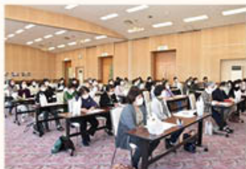
円滑に議事が進んだ会場