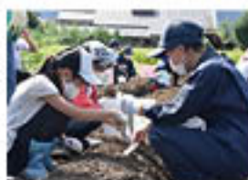
▲昨年度開講の様子