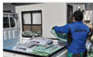
車に肥料を積み込むJA職員

JAでは、年間特別予約の大量発注と、肥料の自己取りによる輸送費の削減によって注文価格の低減につなげています。