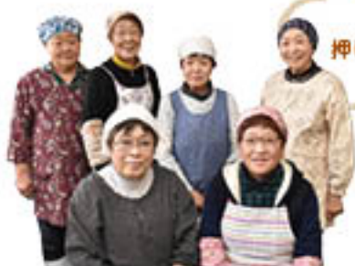
女性部更北総支部のみなさん