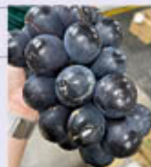
▲裂果したナガノパープル