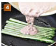
4 生地がアスパラガス全面に乗るように広げる。