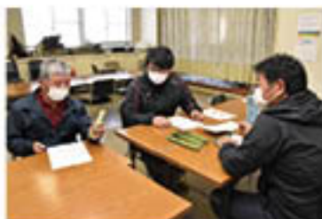
出荷規格を説明した少人数講習会

野菜部会アスパラガス専門部で「アスパラガス」の出荷が本格化しました。ハウスで栽培されたものが2月から始まり、4月の露地栽培品へと出荷リレー。3月10日には松代農業総合センターで出荷講習会を開き、生産者が出荷規格・方法を確認しました。JAでは、露地品も含め6月上旬頃まで地元市場を中心に出荷する予定です。