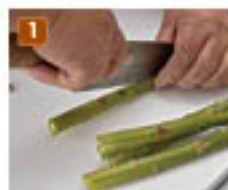
1 アスパラガスはフライパンに入る長さに調整する。