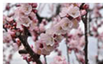
一日で一気に開花したあんずの花

これを踏まえ、JAでは「農作物凍霜害対策本部」を設置。凍害が懸念される日には、営農情報配信システムなどで注意喚起し、被害防止に努めています。