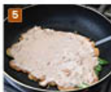
5 崩れやすいので注意しながらひっくり返す。